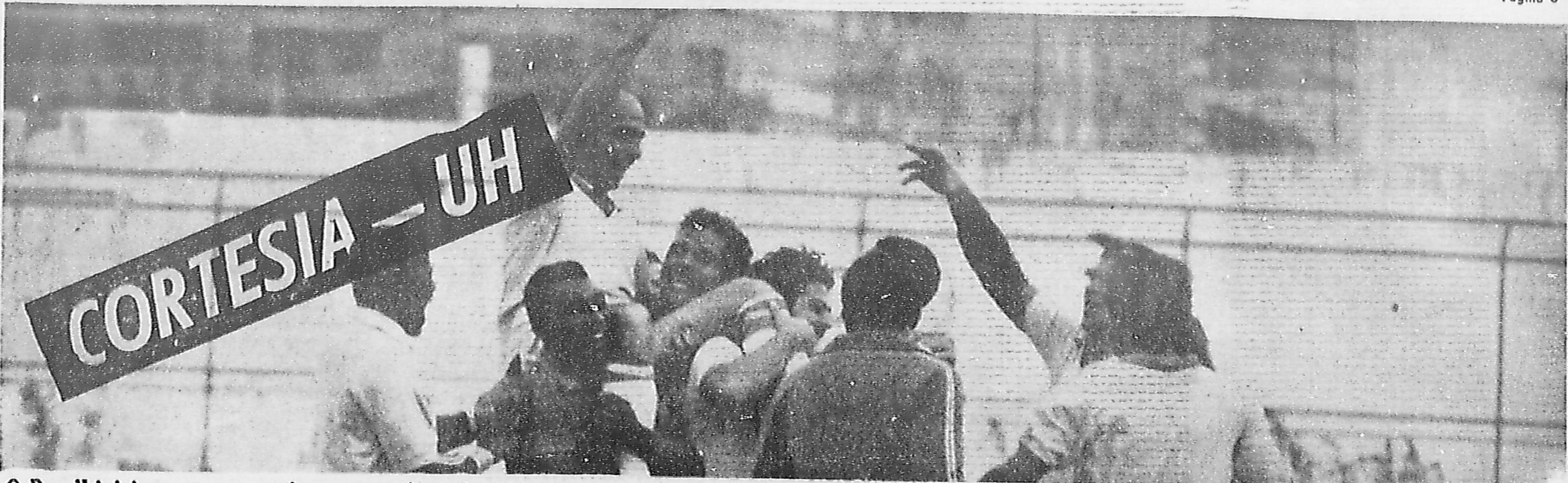
O Brasil iniciou ontem os treinos para o jogo de amanhã contra os colombianos, que chegaram exaustos: pane atrasou o avião duas horas. (Páginas 9 e 10)