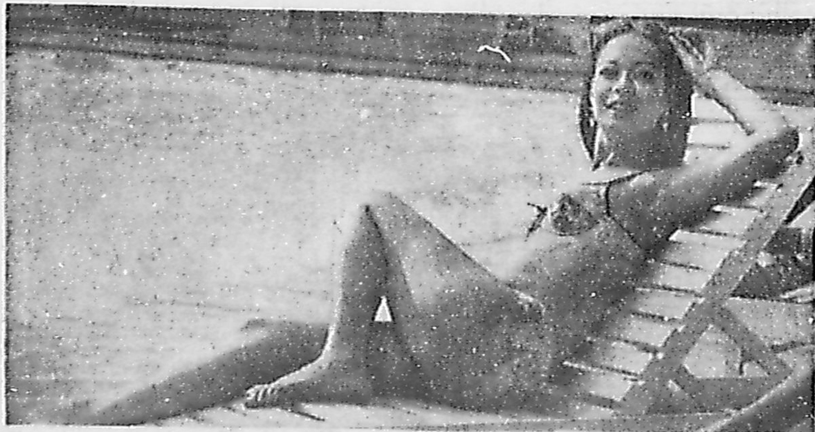
Assalto não mexe com nervos da Miss Universo (Pág. 3)