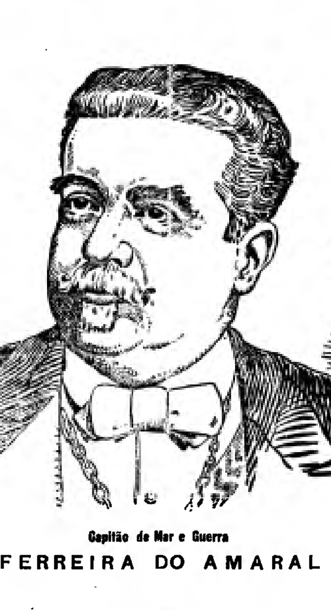
Capitão de Mar e Guerra FERREIRA DO AMARAL

Na Brigada Policial está assim distribuido o serv. (a) para hoje: Superior do dia o sr. major Oliveira; o regimento de cavallaria dá 4 officiaes para ajudantes de dia, rondas e o serviço do costume; o 1º batalhão, a guarda e respectivos officiaes; o 2º, guarda da Alameda; o 3º, policiamento da capital e 2 officiaes para rondarem os districtos de Brás e Santa Efigenia; o Corpo de Bombeiros, o serviço do costume; promptido o estado, a banda de musica do 3º batalhão; amanuense de dia, sargento James. Uniformes, 13-.