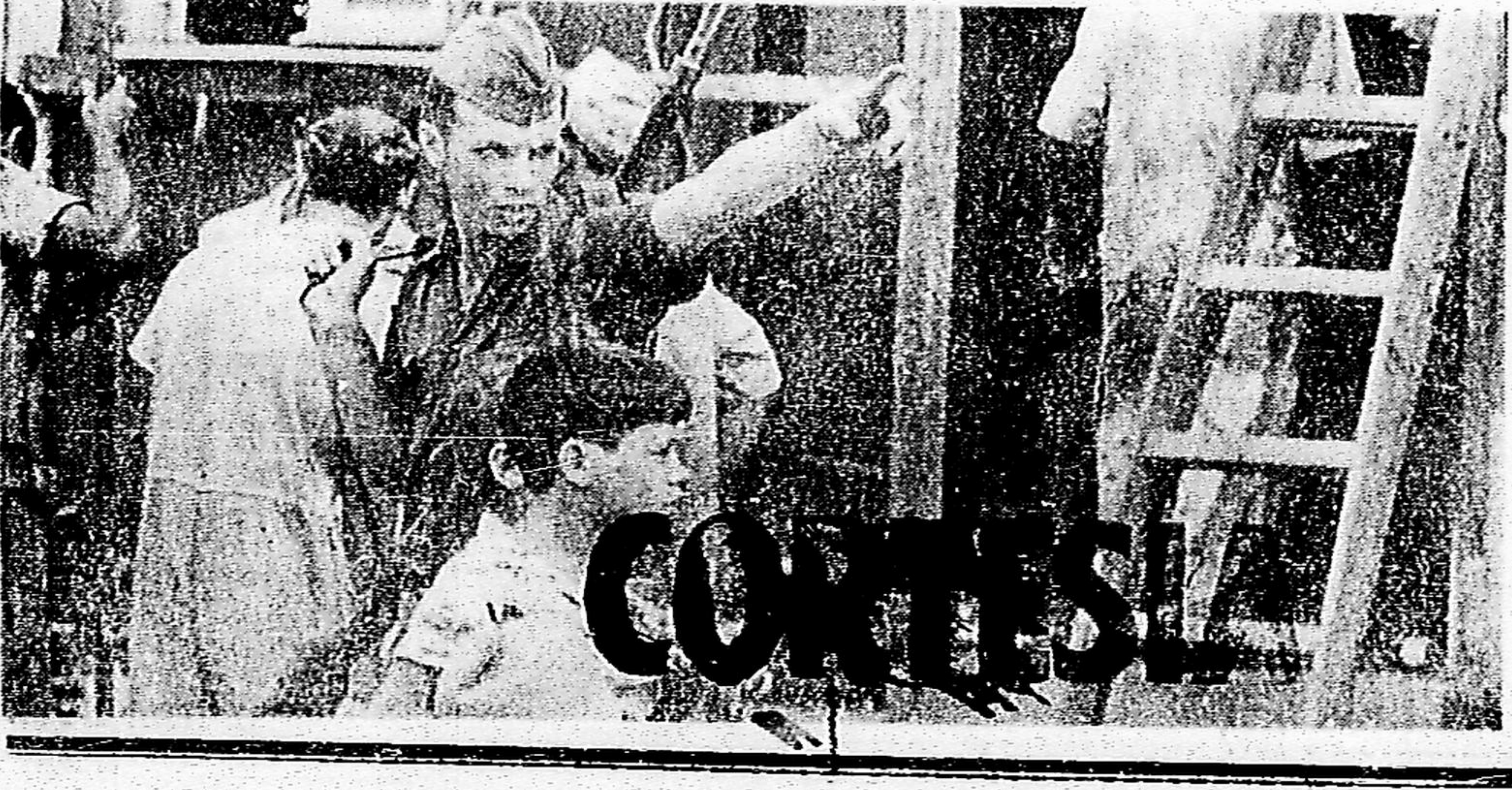
A demolição de 7 casas comerciais, no Caju, foi garantida por Tropa da FAB. Depois, 60 famílias serão despejadas (P. 5)

"paz em todas as camadas, paz entre os intelectuais e entre os trabalhadores; na área política e na área militar". As derrotas do Governo no Congresso, segundo o Marechal, são provas de que ali se legisla em clima de liberdade: a alegação de interferência ou prepotência do Executivo "é uma infâmia", que eu repilo violentamente." (P. 2) O Senado dos Estados Unidos pediu, por decisão unânime, ao Governo que negocie junto à ONU para obter rapidamente a paz no Vietnã. A votação uniu 82 parlamentares de todos os partidos e tendências. Os líderes declararam que era hora de "se fazer uma prova, ganhemos, perçamos ou empatemos". Sugeriram o pronunciamento do Conselho de Segurança. A decisão do Senado, seguindo-se à renúncia de McNamara, Secretário de Defesa, parece indicar uma próxima alteração radical na política dos EUA no Vietnã.