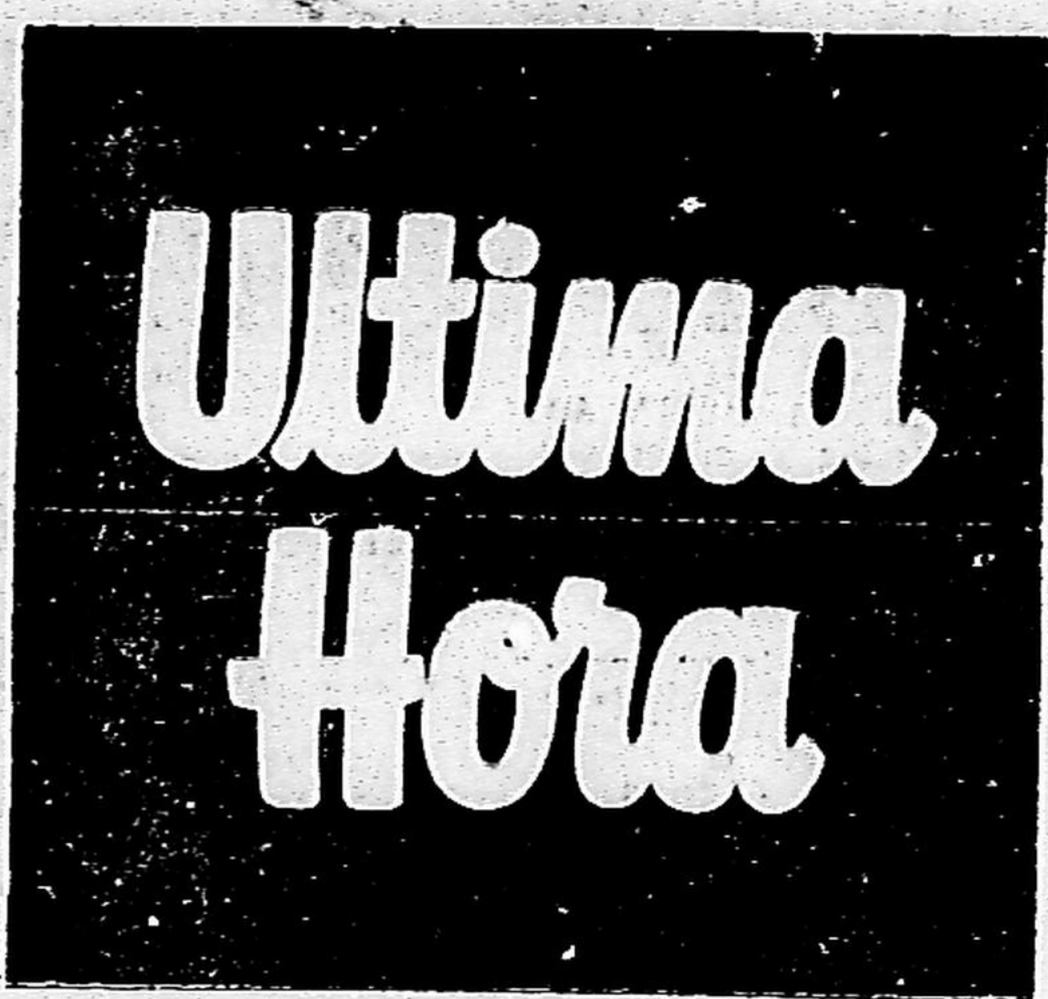
Ano XVII — Rio, 6.ª-Feira, 1/12/1967 — N.º 2.172 — NC15 0,20

Sete mil dos dez mil habitantes de Beçar ficaram desabrigados em consequência do terremoto verificado ontem naquela cidade, na fronteira entre a Iugoslávia e a Albânia. Quase toda a cidade ficou destruída. Oitenta por cento das casas desabaram mas, apesar do grande número de desabrigados, a maioria nada sofreu por ter o fenômeno ocorrido durante o dia, dando tempo a que quase todos eles abandonassem suas residências. Também as regiões albanesas de Dibra e Librazhd foram atingidas pelo tremor, que fez ainda desabar duas mil casas, matando vinte pessoas e ferindo outras 134. Todas as comunicações com Beçar estão interrompidas, informando-se ainda que a cidade permanece sem água e sem energia. (Página 6)