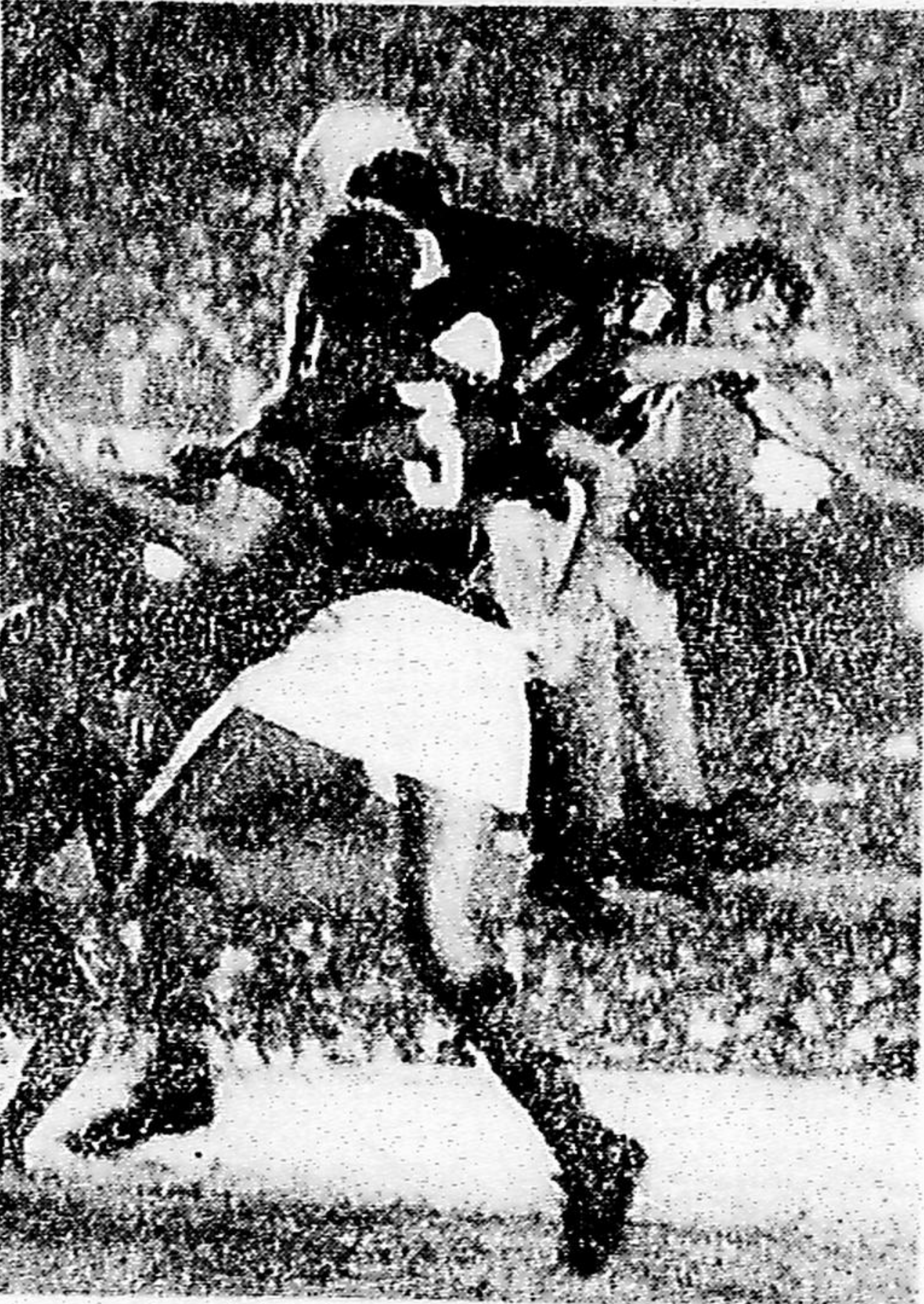
Botafogo venceu de 1x0, mas o Fla não assustou (P. 10)

As 5.068 candidatas às escolas normais da Guanabara que passaram pelas provas de Matemática e História fizeram ontem o exame de Geografia, considerado o mais difícil até agora. A tarde, centenas de pais e alunos formavam multidão nas portas das escolas, curiosos para saber o resultado das provas. Estas ontem mesmo foram submetidas ao computador eletrônico que eliminou cerca de 4 mil candidatas nos testes iniciais. As provas finais de Ciências e Português serão realizadas nos dias 12 e 22 de dezembro, às 15 horas.