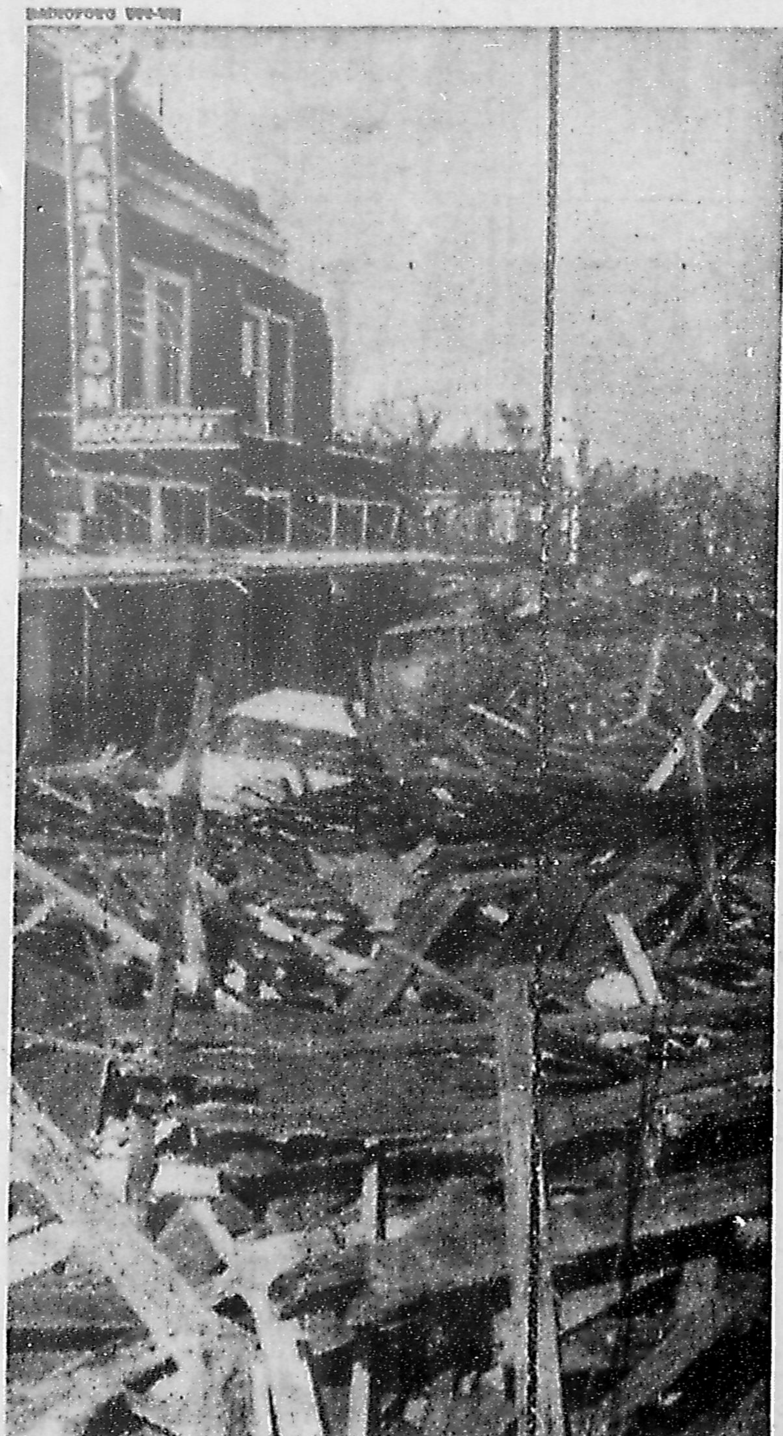
Outro furacão sôbre os EUA: "Camille" mata 500 (P. 6)