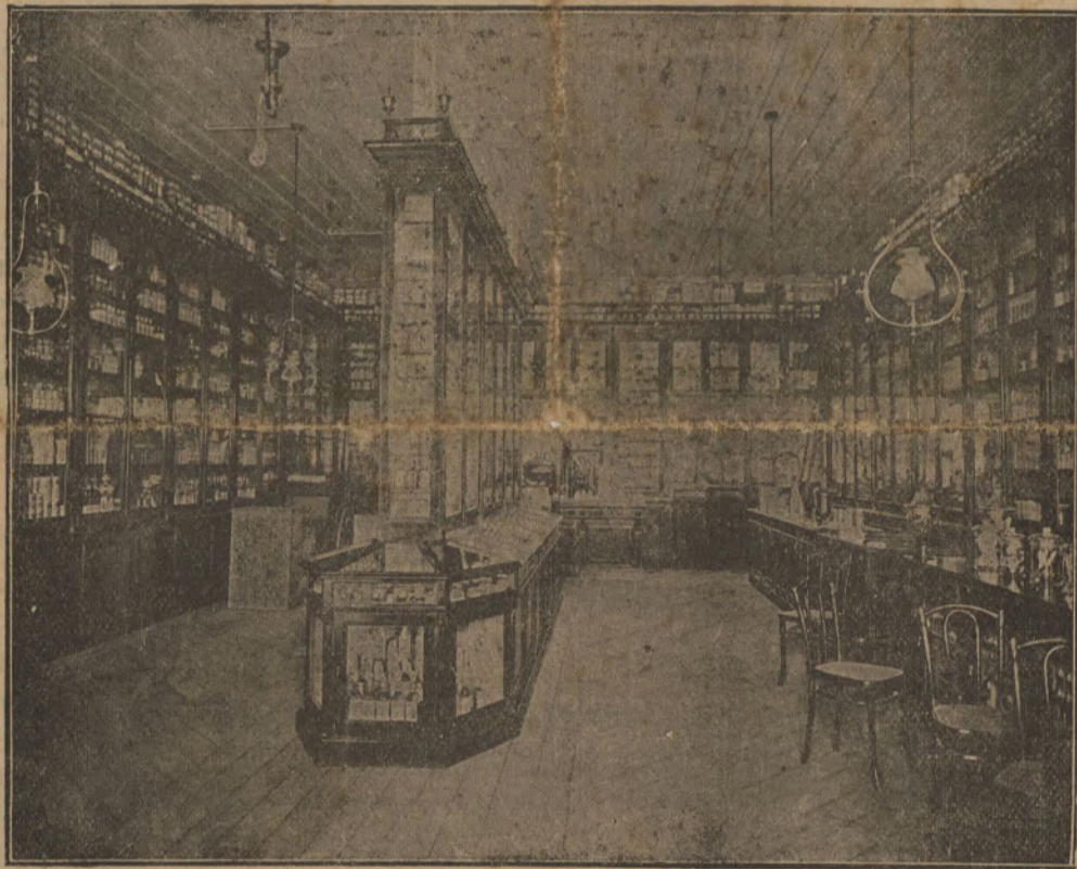
Vista do interior da Drogaria Americana de L. Queiroz & Comp.

Os productos da casa L. Queiroz & C. são hoje conhecidos em S. Paulo e nos outros Estados da Republica e são preferidos pelo cuidado e esculpulo com que são manufacturados.»