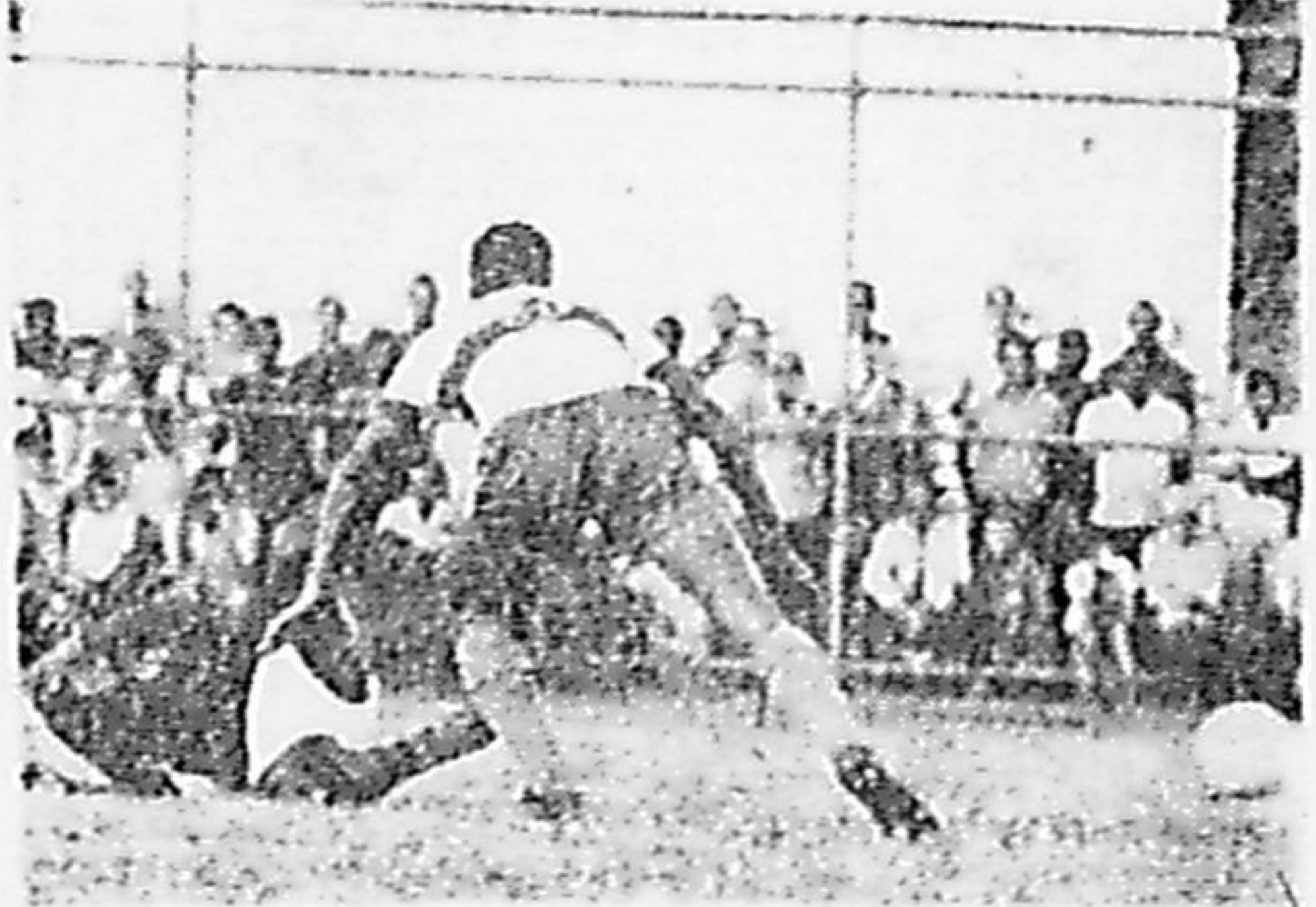
Liminha, como o Fla, parou na firme defesa do Olaria