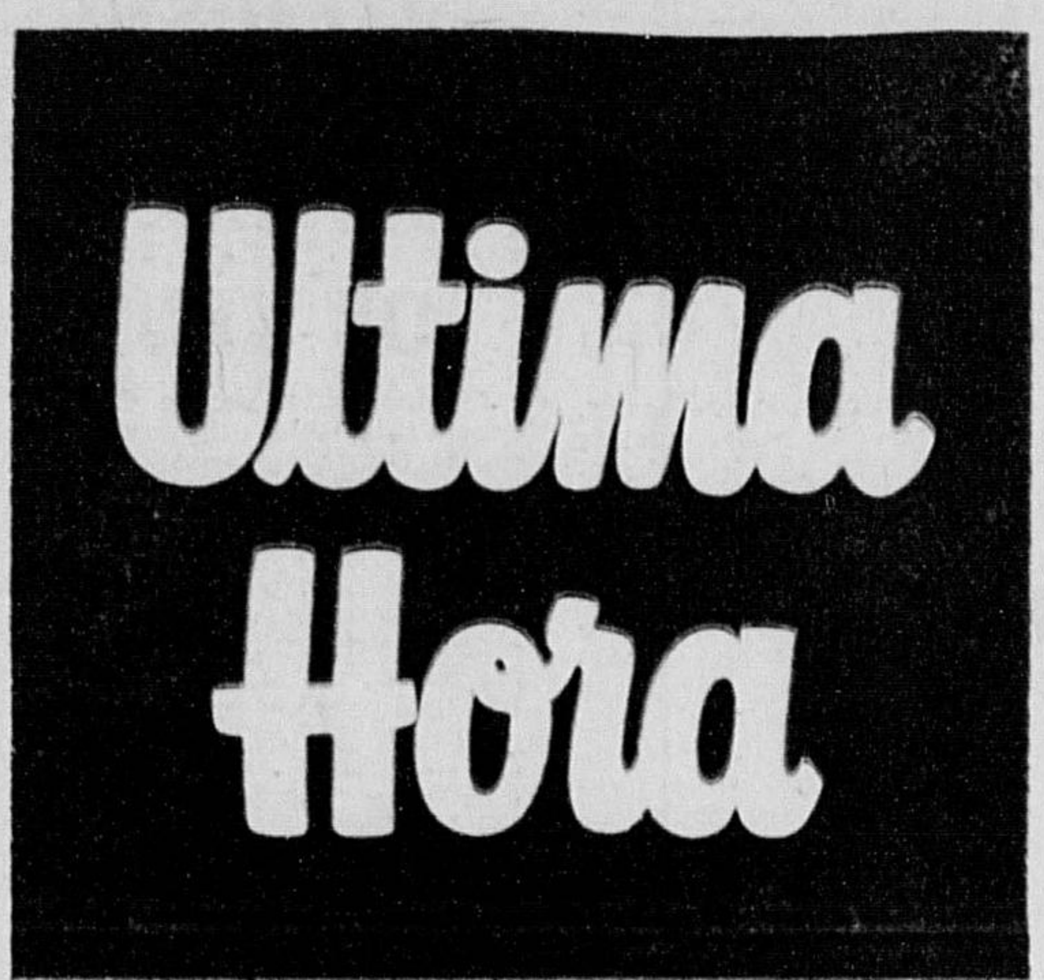
Ano XVII — Rio, 3.ª-Feira, 28/11/1967 — N.º 2.169 — NCr$ 0,20

O Senado autorizou ontem o Governo da Guanabara a negociar o financiamento de 10.680.086 marcos com firmas nacionais e alemãs que projetarão o metrô carioca. Está em vigor o prazo de oito meses destinado à conclusão dos estudos preliminares para a implantação do novo sistema de transportes. A Comissão do Metropolitan já informou que o traçado da linha prioritária deverá ser conhecido dentro de 90 dias.