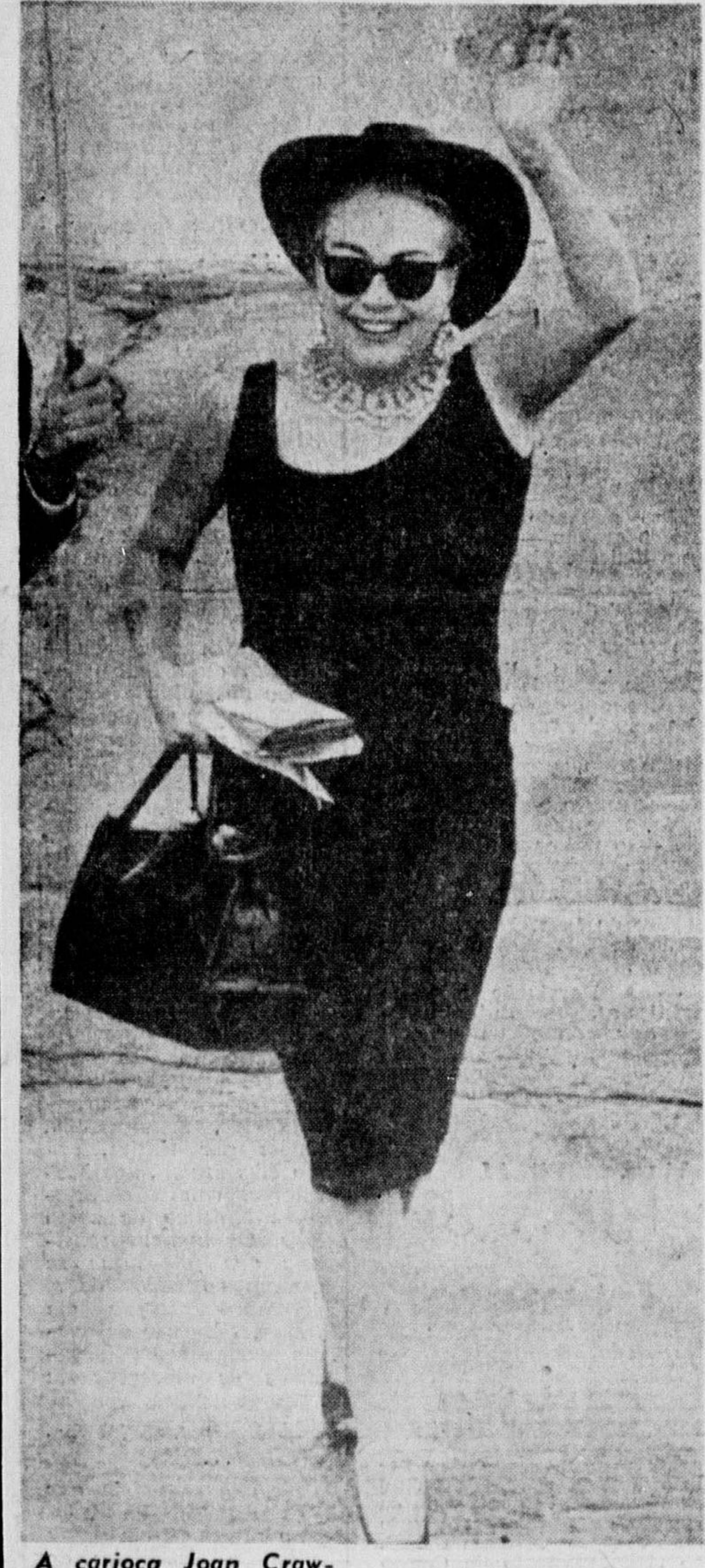
A carioca Joan Crawford — o título vai ser formalizado solenemente na sexta-feira — chegou ontem para inaugurar mais uma fábrica de sua empresa, a Pepsi-Cola. Vitoriosa capitã de indústria, não abandonou, contudo, o cinema, onde, com pesar, não vê mais o amor. Predomina agora o épico, disse, em resposta à concorrência da TV. A estrela de tantos êxitos dramáticos — 80 filmes — desembarcou com um chapéu preto estilo texano, vestido da mesma cor, colar de brilhantes e muita maquiagem que se desfez ao calor dos refletores. Uma pergunta, sobre se deixara de filmar, levou-a a uma contestação veemente: — Não e não. Como não estou filmando, se ainda agora terminei um filme em Londres, Dessert? A película vai ser lançada na Europa, em janeiro, e a expectativa de Crawford é o público.