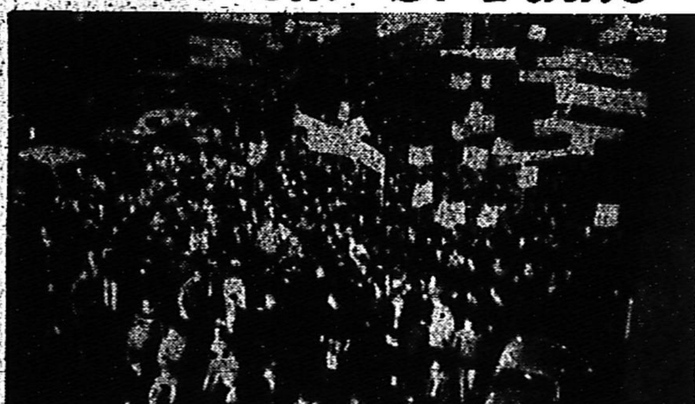
Os estudantes de Guanabara e de São Paulo voltaram, ontem, a promover manifestações, os primeiros reivindicando a reabertura do Restaurante do Calabouço e os últimos realizando concentração e passeata de protesto contra o ato que limitou em 36 o número de aulas semanais obrigatórias. (Leia nas páginas 2 e 6)