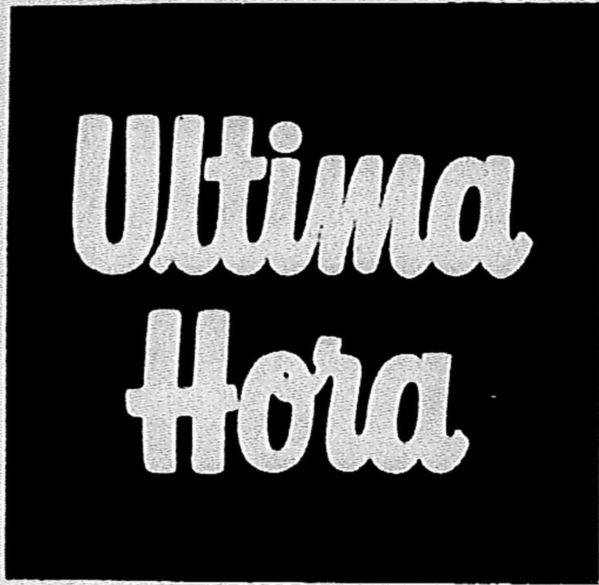
Ano XVII — Rio, 3.ª-feira, 19.12.1967 — N.º 2.184 — NC15 0,20

A Ação Operária Católica do Rio Grande do Sul denunciou o regime de insegurança e a política salarial injusta. Em São Paulo, dirigentes da Juventude Operária Católica anunciaram sua participação nas próximas concentrações contra o arrocho salarial. (Página 7)