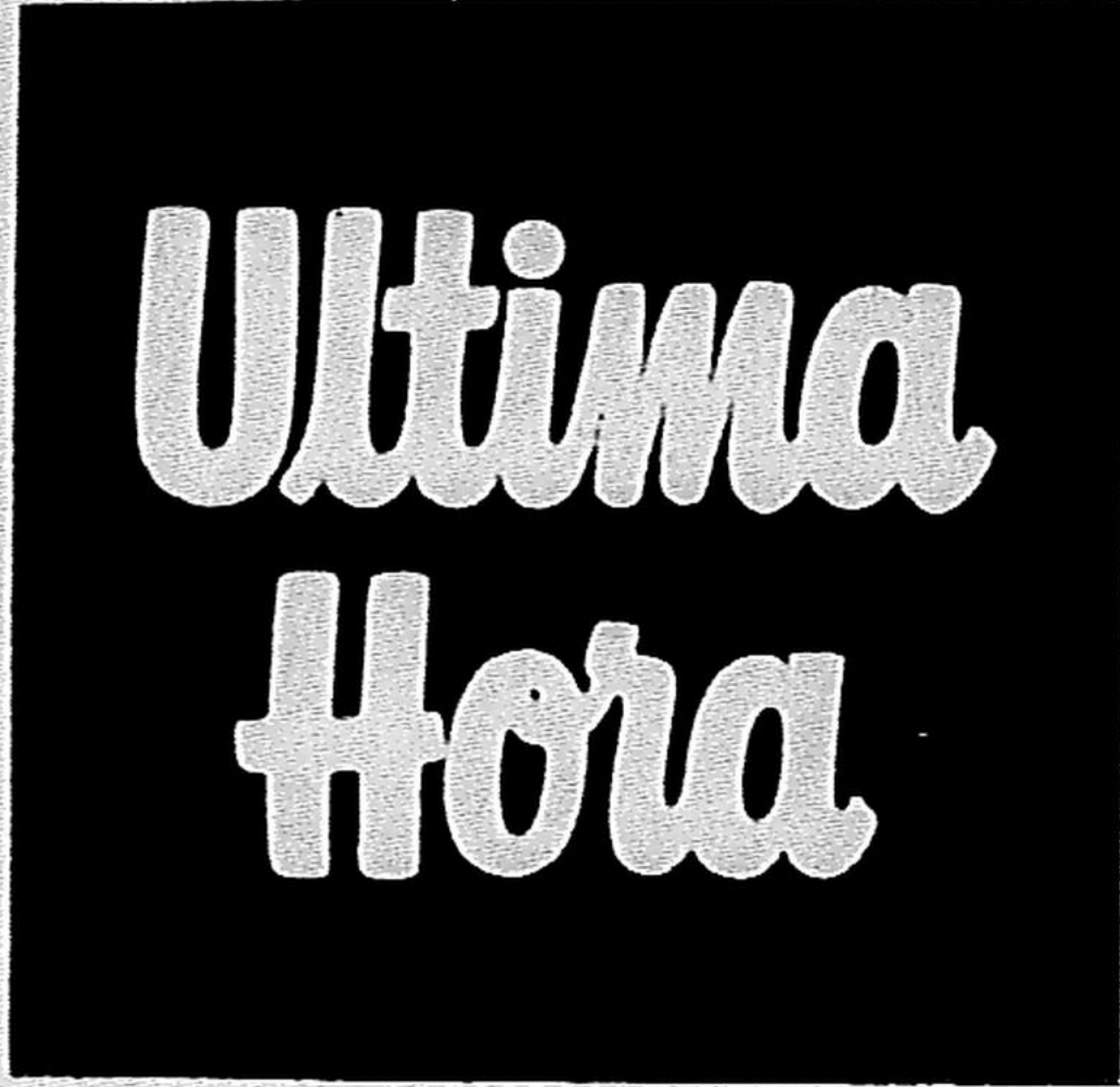
Ano XVII — Rio, 3.ª-feira, 19.12.1967 — N.º 2.184 — NC15 0,20

A Ação Operária Católica do Rio Grande do Sul denunciou o regime de insegurança e a política salarial injusta. Em São Paulo, dirigentes da Juventude Operária Católica anunciaram sua participação nas próximas concentrações contra o arrocho salarial. (Página 7)