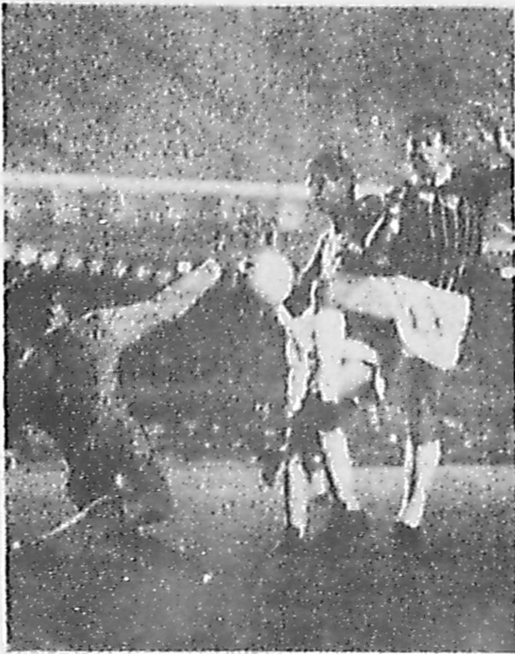
Flu fácil passou outra vez pelo Bangu: dois a zero.