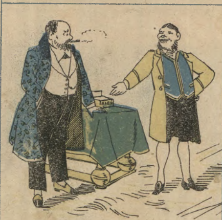
O que muito lhe custou, foi acostumar-se aos charutos de Havana. Nada como os fusileiros !