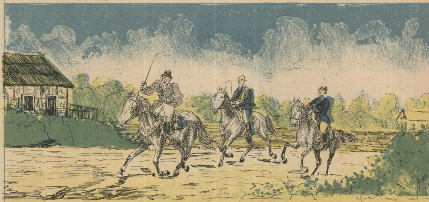
e assim voltaram para sua freguesia, fazendo figura, em bellos cavallos, de sua propriedade.