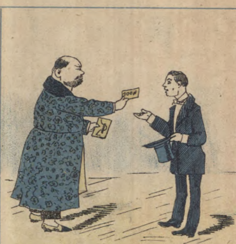
Os afilhados, que eram poucos, quando appareciam, tinham uma de «cem» para o bond.