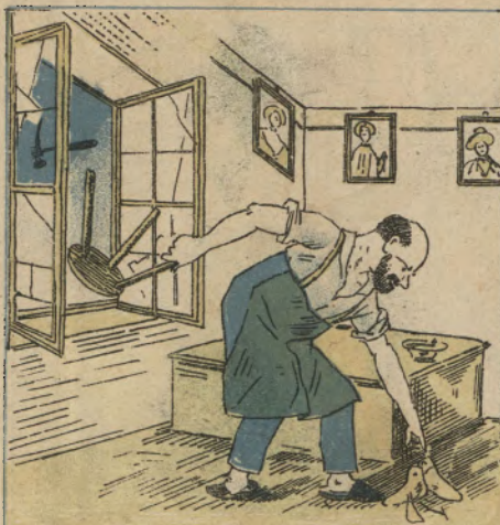
Este bom sapateiro, tirou a sorte grande de S. Paulo, e atirou com a ferramenta para a Rua.