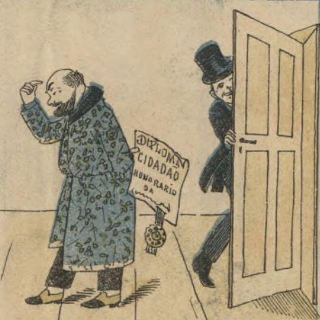
O que o desgostou muito, foram as 3.000 nomeações, de socio benemerito de qualquer coisa, que lhe offerceram