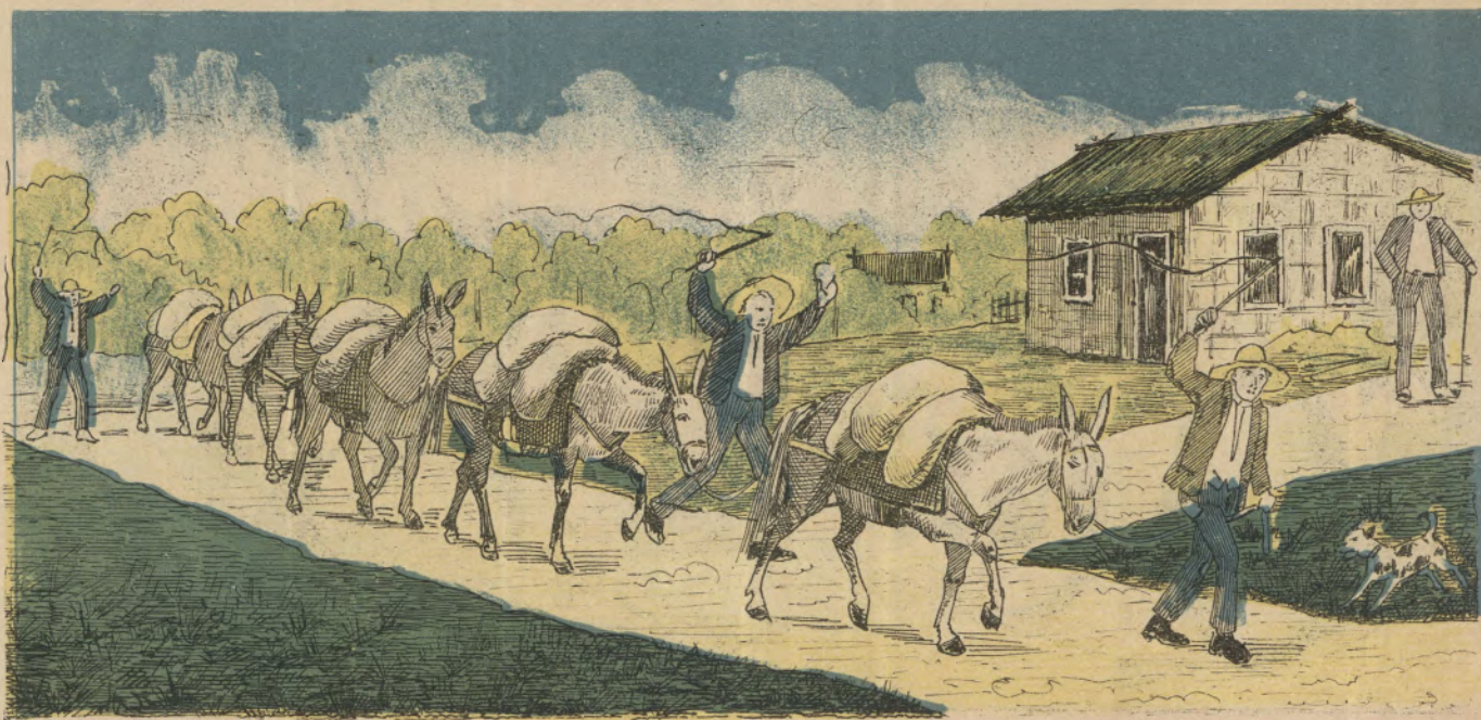
Assim vieram a S. Paulo, os tres felisardos, de S. Bernardo, que tiraram os 60 CONTOS DA 1ª GRANDE LOTERIA DE S. PAULO