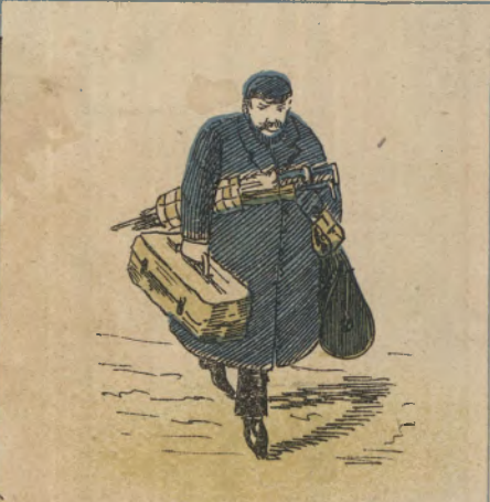
... e resolveu ir para Europa gosar o bello premio da Loteria de S. Paulo.