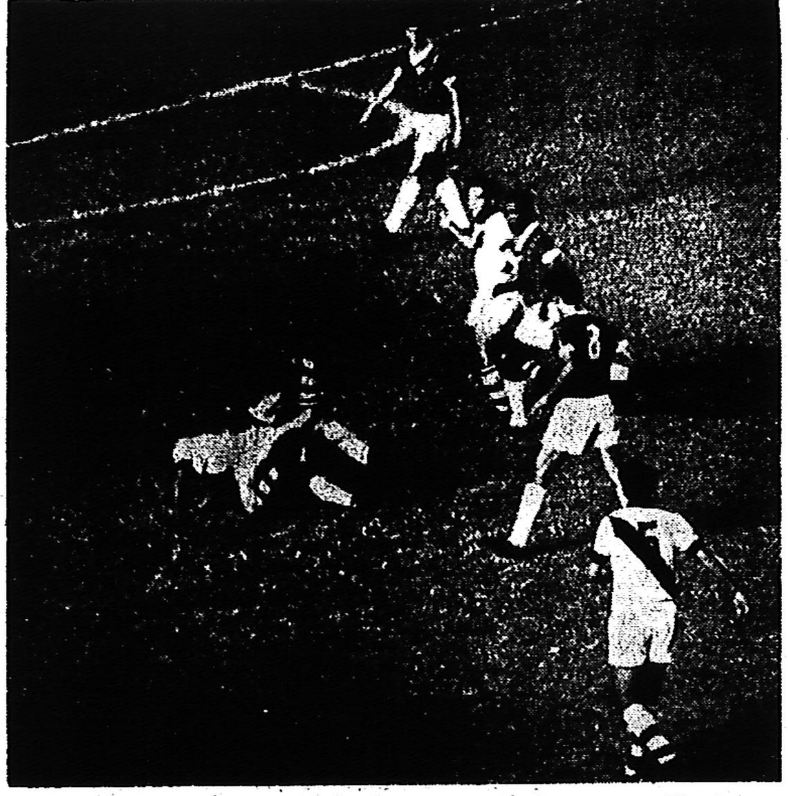
Jogando com muita decisão e entusiasmo — aliados à sorte —, o Fluminense conseguiu empatar ontem com o Vasco por zero a zero, resultado que beneficiou principalmente o Botafogo e o Flamengo — ambos embolados na disputa de título. A defesa do Flu foi uma verdadeira barreira humana. (Cad. Esportivo)