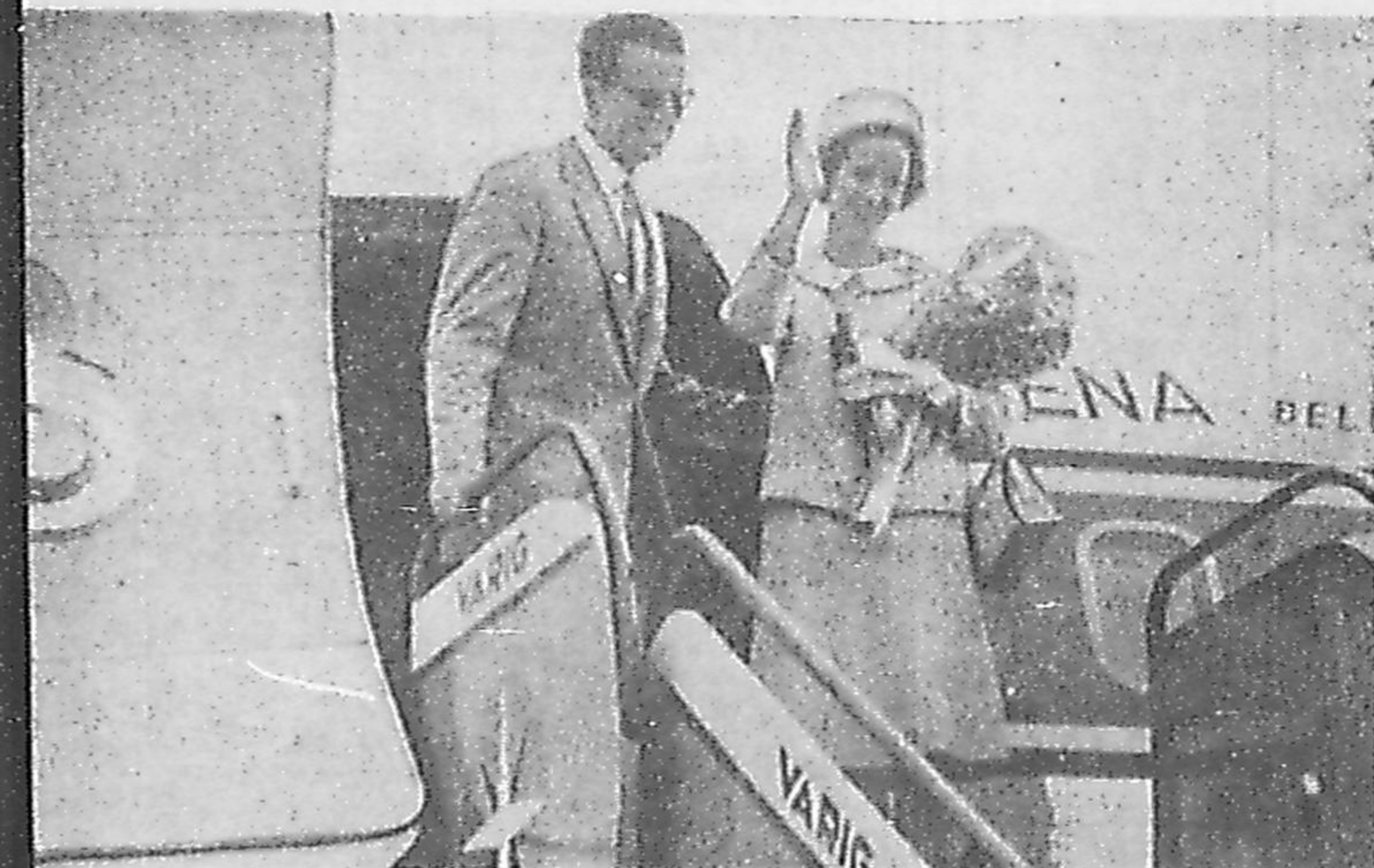
INTERROMPENDO a viagem que ainda cumpriria pelo Brasil, incluindo Bahia e Pernambuco, Balduino e Fabiola embarcaram ontem à tarde no Galeão, de regresso a Bruxelas. Motivou a suspensão da visita dos reis belgas o estado de saúde da Rainha-avó Elisabete. Na despedida do Rio, o casal real mostrou os pontos pitorescos da cidade, terminando o passeio no Mirante. (Leia noticiário na página 8)