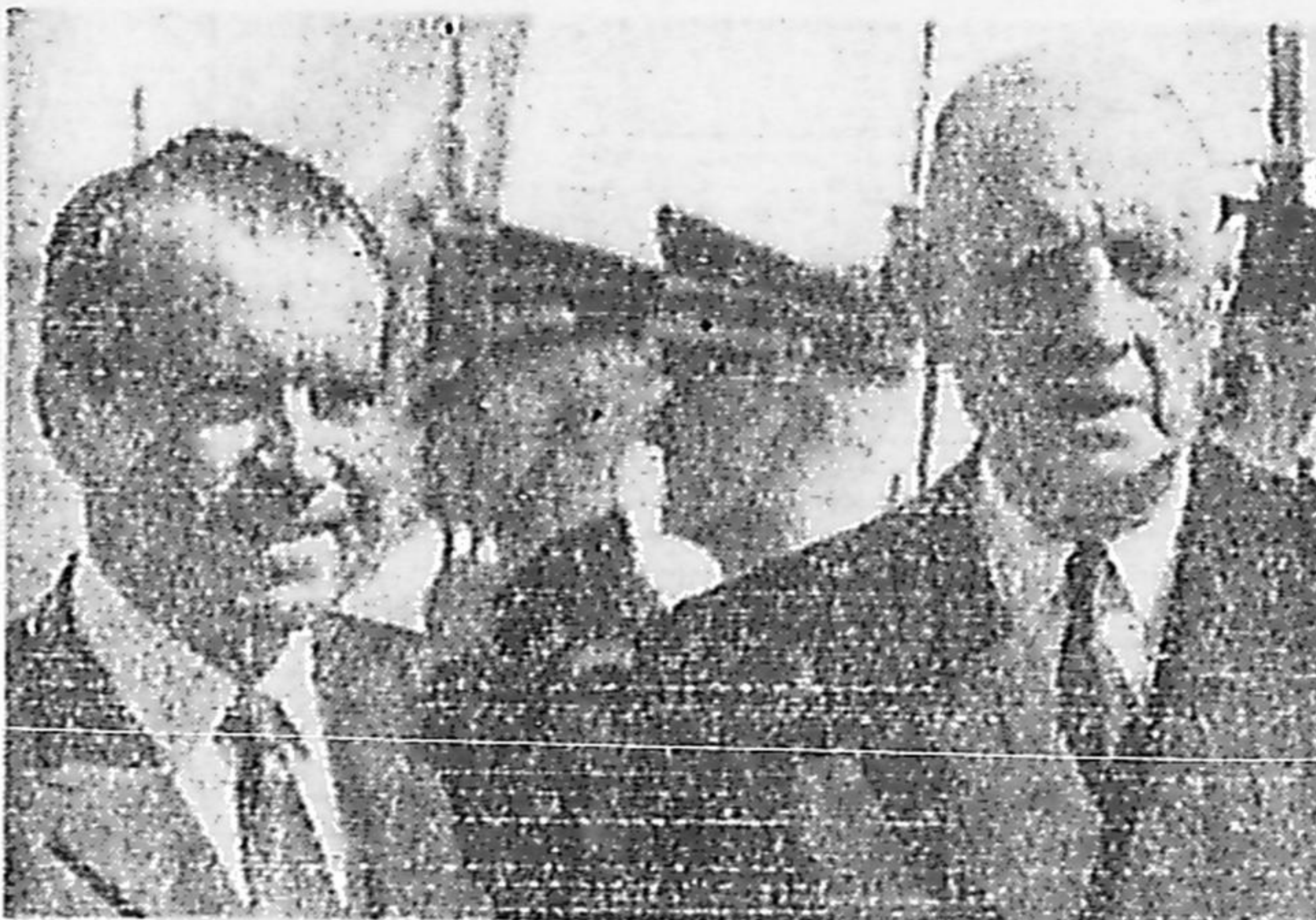
As exéquias de Eisenhower reuniram outra vez De Gaulle e Nixon, que conferenciaram por 55 minutos na Casa Branca. Participaram do adeus a Ike três reis e cinco presidentes. (Página 6)