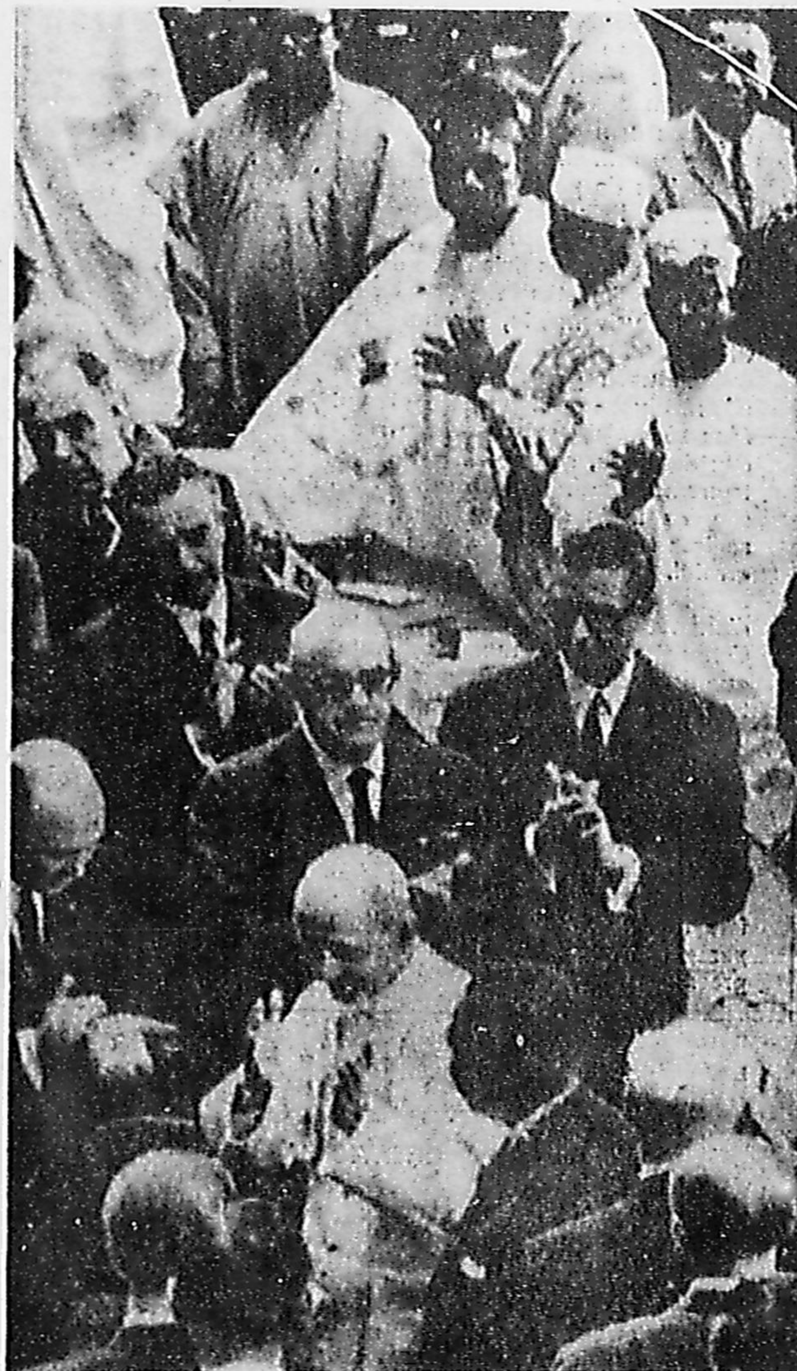
Em torno de Paulo VI, na Suíça, líderes mundiais do Trabalho e da Fé

Só 9 fanáticos tentaram agitar Genebra (Pág. 7)