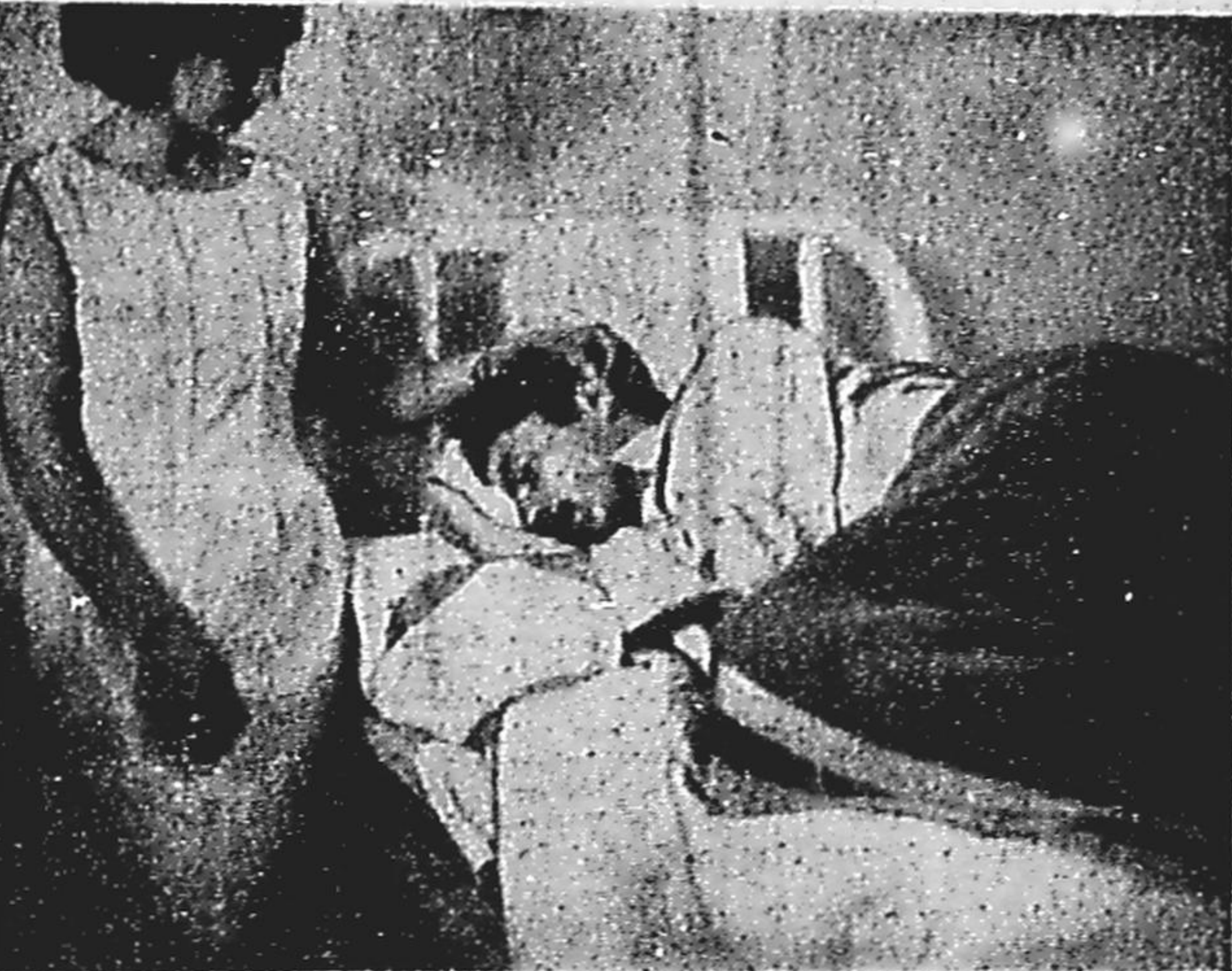
Dois guardas armados bloqueiam, noite e dia, o quarto do Hospital Felício Roxo onde está internado o Deputado Sinal Bamberga, com suspeita de fratura no crânio. Bamberga, que é deputado e presidente do Comando Estadual dos Trabalhadores, foi um dos elementos mais risados pela fúria ibadiana. Na foto, ele aparece com sua esposa.