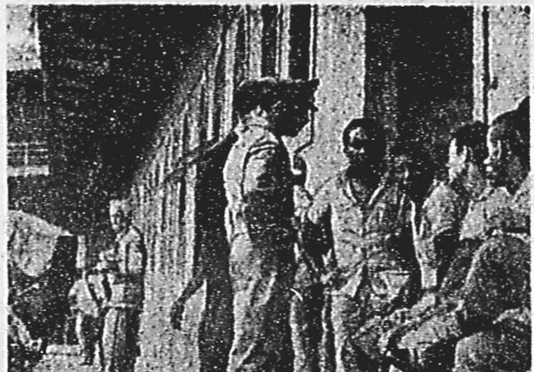
Optantes esperaram o dia todo.

O Comando da Polícia Militar da Guanabara está se negando a ir ao Ministério da Justiça receber, do Grupo de Trabalho dos Optantes, a verba federal para o pagamento dos vencimentos do corrente mês. Afirmou que não tomou conhecimento da existência dessa verba, desde o decreto-lei de opção. Os optantes da PM, principalmente aposentados e pensionistas, passaram toda a manhã à espera do pagamento, que não veio. (P. 7).