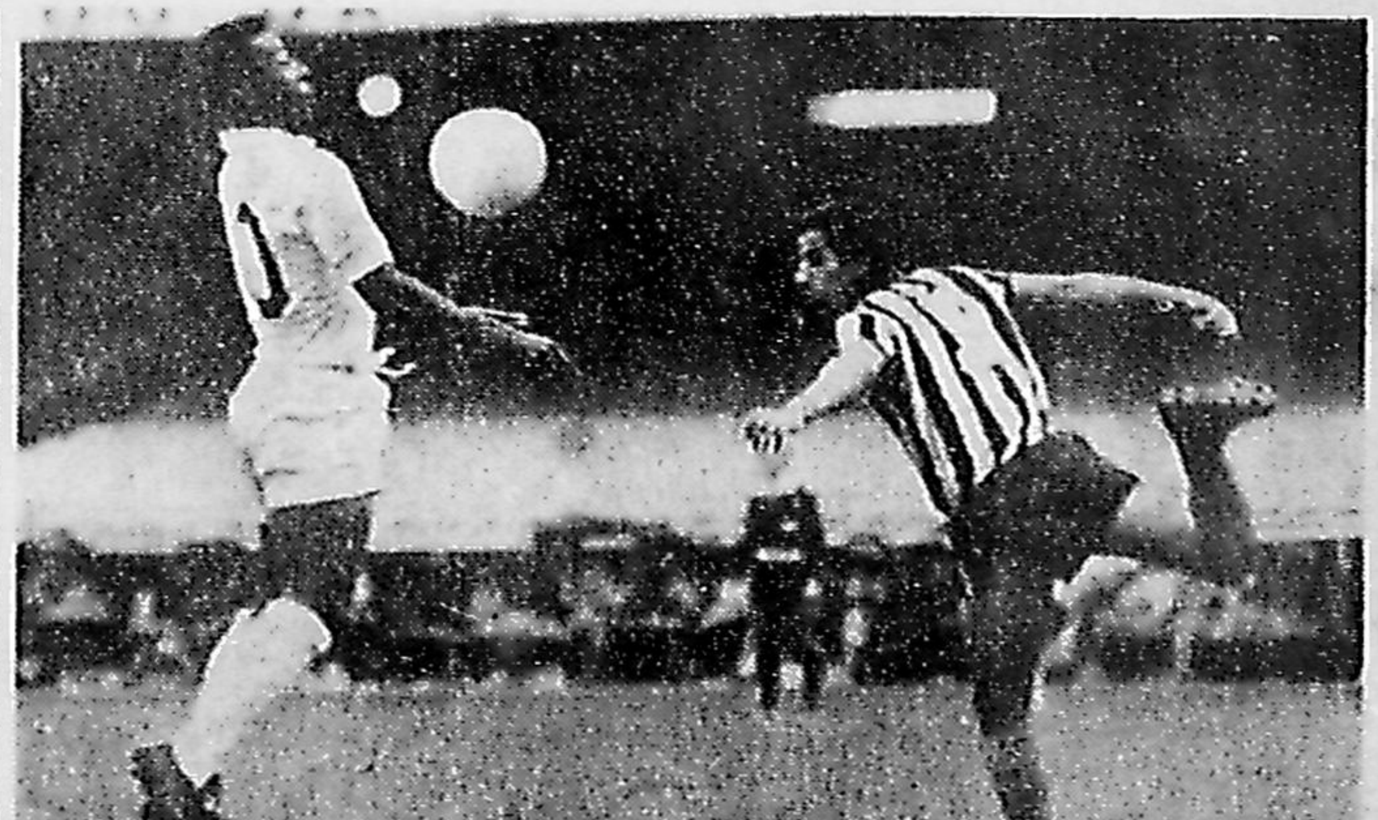
Centa e trinta mil pessoas foram ao Maracanã ver seu Mané de volta. Os portões foram arrombados. E, de fato, Garrincha reeditou o seu futebol-arte, numa noite de festa em que o Vasco assegurou uma vaga entre os 4 grandes do "Robertão", vencendo o Fla por 2 x 0. Ontem a festa foi do Botafogo, que derrotou o Santos por 3 x 2. Quarta-feira, na fase decisiva, o Vasco joga com o Palmeiras e, na quinta, o Santos enfrenta o Inter. (Leia no Caderno Esportivo)