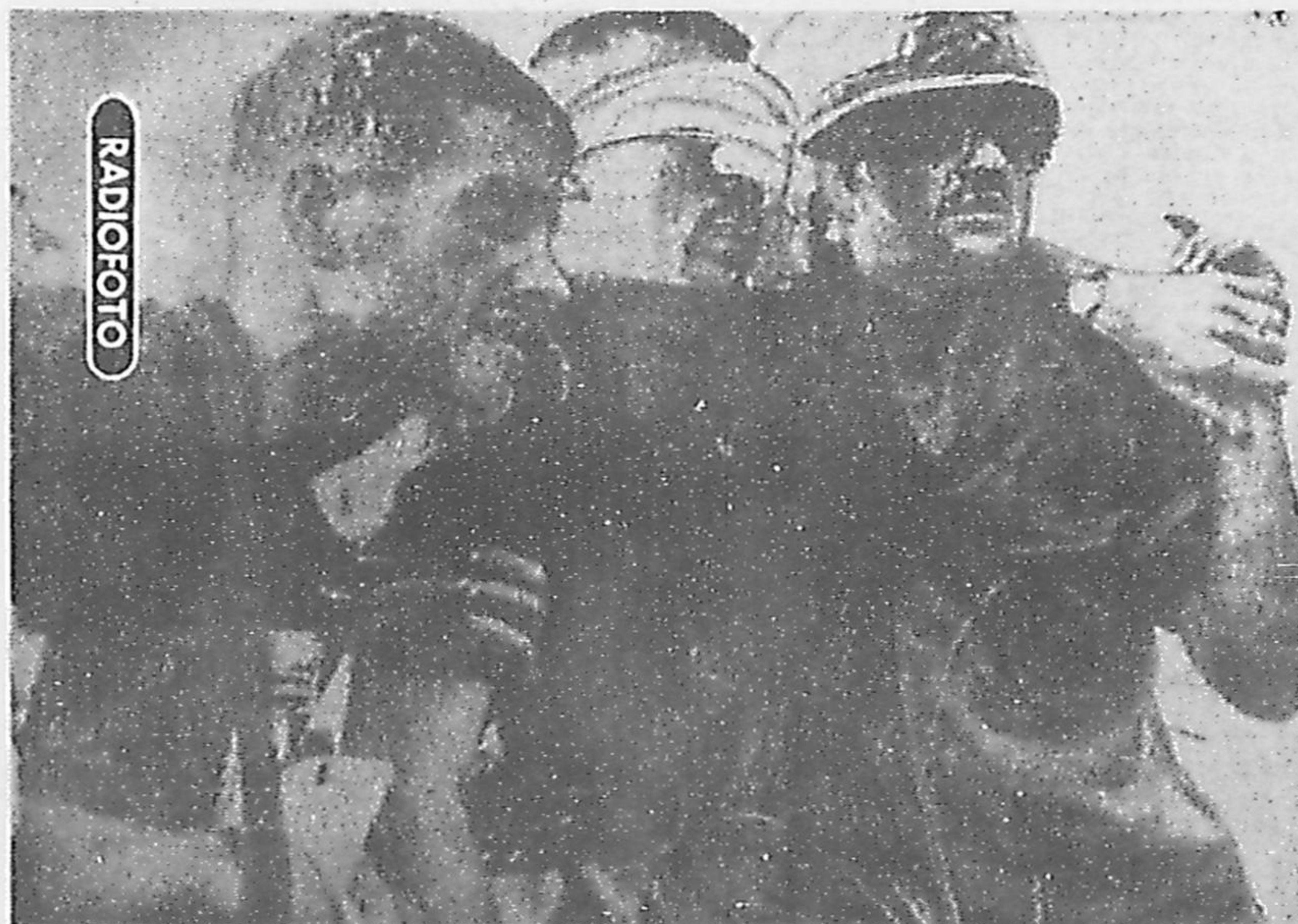
DEPOIS de sete horas de furiosos combates, um batalhão dos EUA, com cerca de 600 homens, foi dizimado pelos vietcongs, a dez quilômetros de Plei Me. Mais duas companhias norte-americanas que acudiram em socorro tiveram que bater em retirada ante a violência do ataque dos guerrilheiros. Na radiofoto UPI, três soldados estadunidenses, feridos e ensangüentados, ajudam-se mutuamente na caminhada até ao helicóptero que os colocará a salvo. Informou-se em Saigão que a 50 km dali os vietcongs atacaram uma base americana e destruíram 5 aviões, matando sua guarnição. (Leia na página seis)

O relator do projeto de reajustamento salarial do funcionalismo, Deputado Antônio Carlos, transmitiu ontem em Brasília, aos representantes dos servidores, a última palavra do Ministro Roberto Campos sobre o assunto: o Governo não concorda com a aprovação da emenda que dispõe sobre o pagamento integral dos 46 por cento. A Comissão Mista que examina o projeto de aumento aceitou apenas dois dos 38 recursos interpostos, quais sejam os referentes à efetivação dos interinos e à classificação dos soldados clarim e corneteiro. Os demais recursos, relativos a benefícios para militares, foram rejeitados. — (LEIA NA PAG. 2)