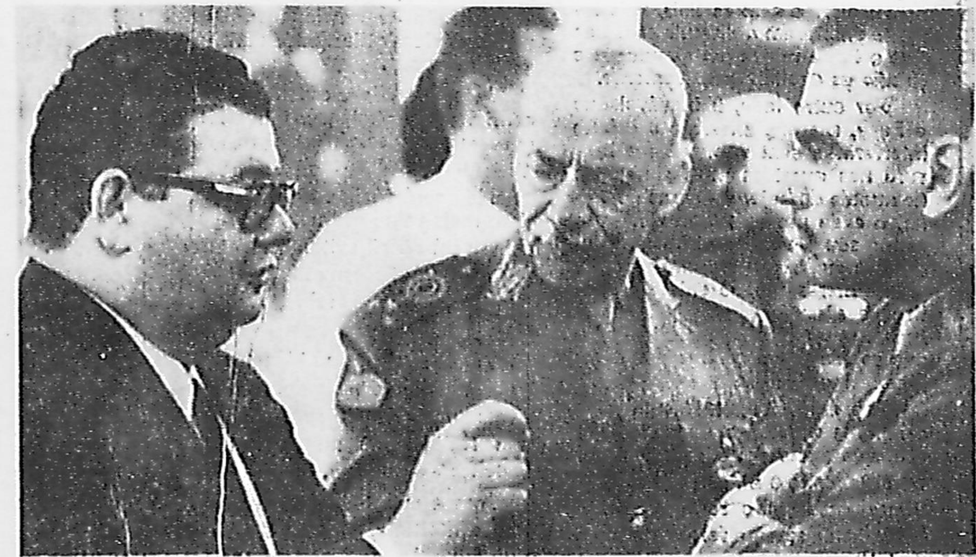
Defendendo a política agressiva no setor do comércio exterior, determinada pelo Presidente Costa e Silva, o Ministro Delfim Neto afirmou, ontem, na Escola Superior de Guerra, que este "é o caminho mais rápido para o Brasil atingir seus objetivos de crescimento". (Leia noticiário na página quatro)