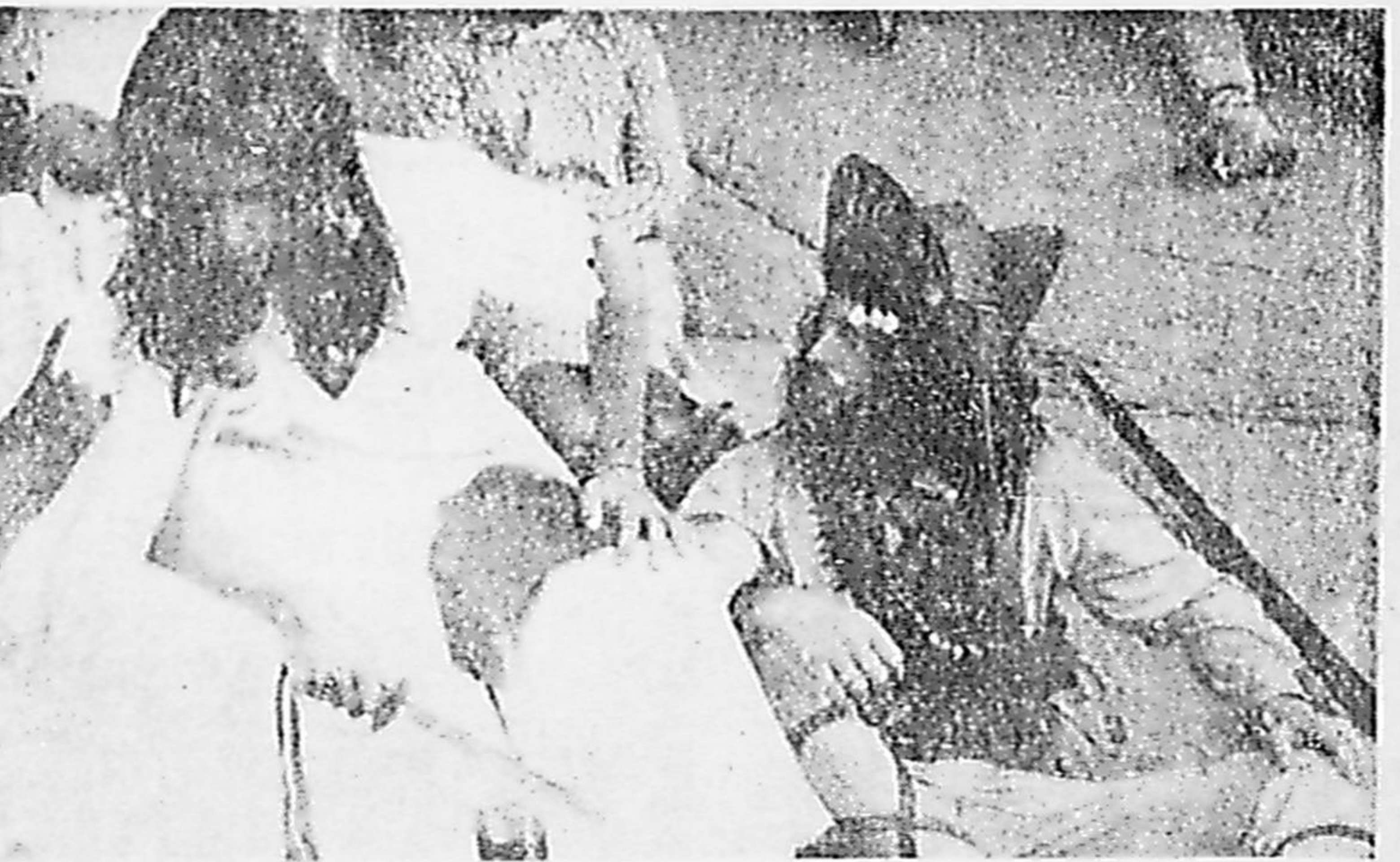
Gláuber já premiado — Hoje dia D em Cannes Com seu filme "Antônio das Mortes", Gláuber Rocha levantou ontem um dos prêmios de Cannes, é um dos concorrentes, hoje, à Palma de Ouro e já tem praticamente assegurado o prêmio especial pelo melhor roteiro. (Leia na página 3 do Segundo Caderno)