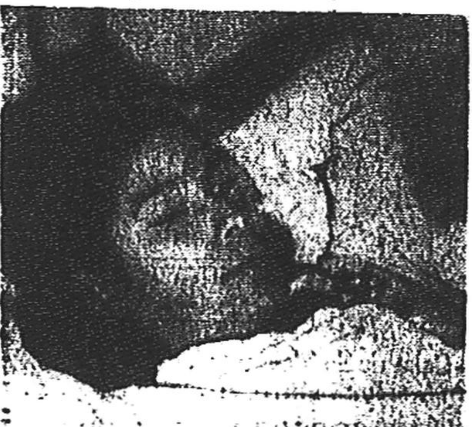
Esta moça sofre de bloqueio auricular e receberá, hoje, em Niterói, um "pacemaker" (marca passo) no coração. (Página 10)