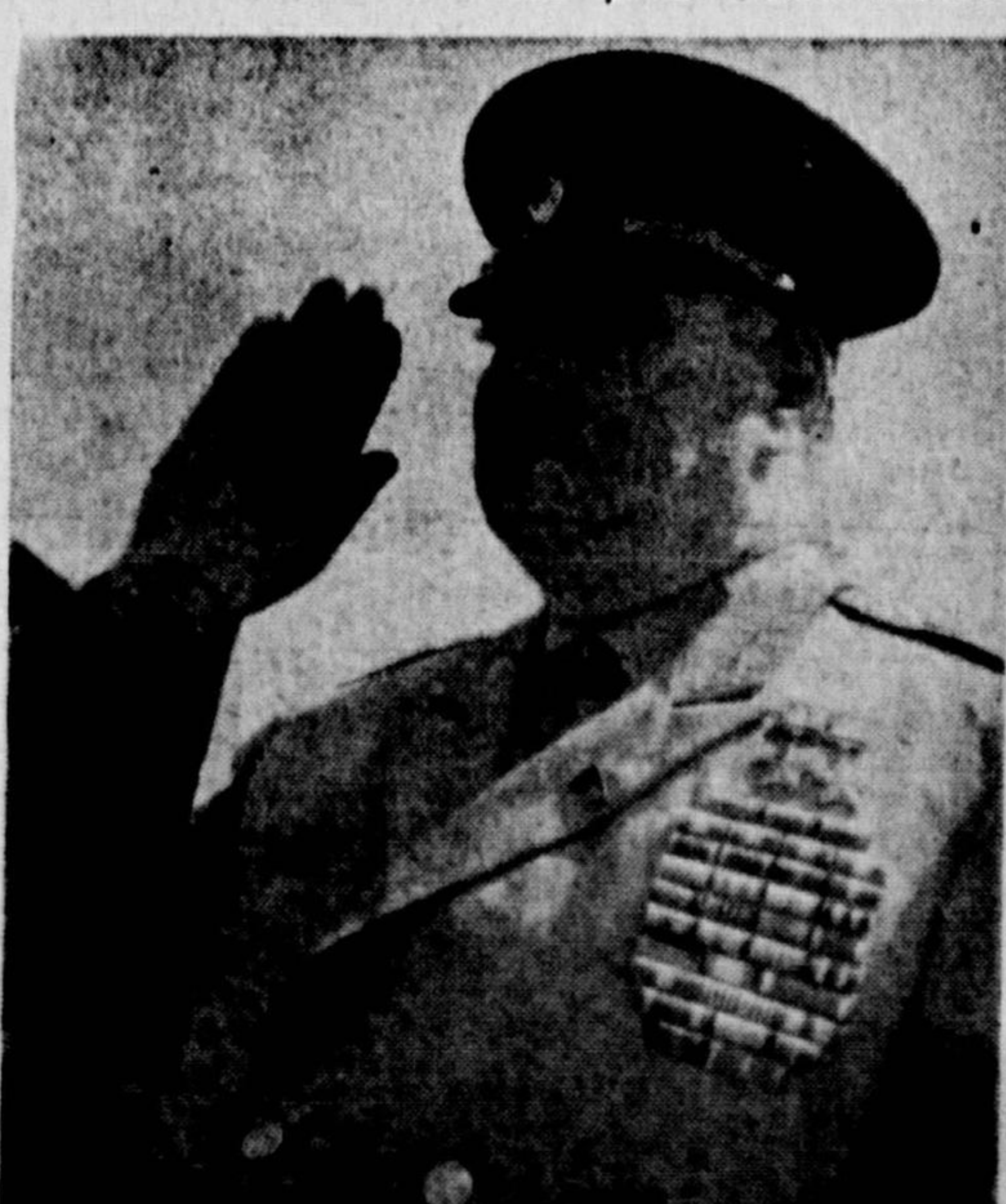
General Yacoboviski, comandante das tropas da URSS

Eslováquia em uma "Nova Hungria", repetindo a intervenção soviética de 1956 em Budapeste, desencadeou uma onda de indignação em todo o mundo. O Presidente Johnson convocou o Conselho de Segurança Nacional para uma reunião e pediu explicações ao Embaixador da URSS em Washington. O Gabinete britânico reuniu-se às pressas e o Vaticano admitiu que os acontecimentos de Praga poderiam resultar no cancelamento da viagem do Papa Paulo VI à América Latina. (Leia na pág. 3)