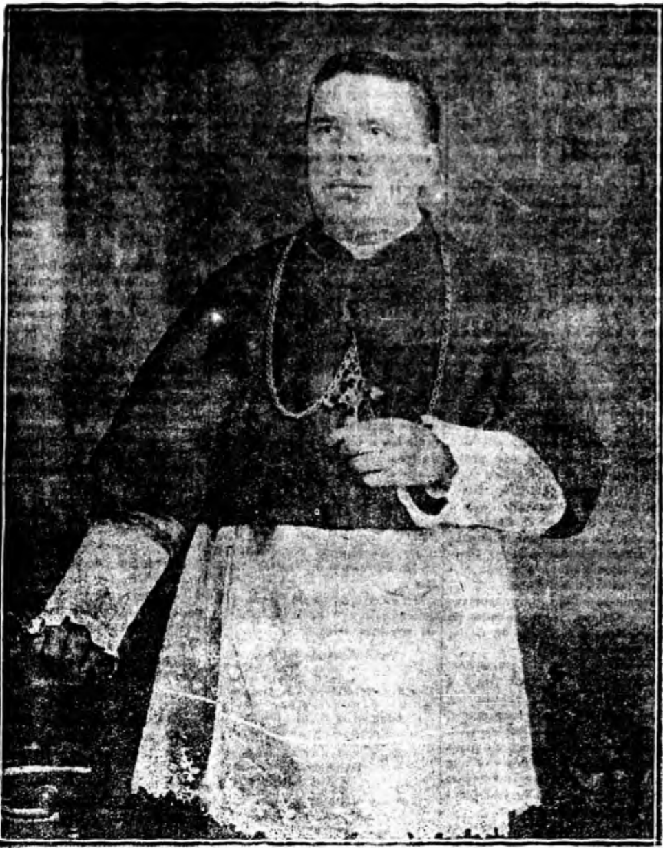
O BISPO DE S. PAULO