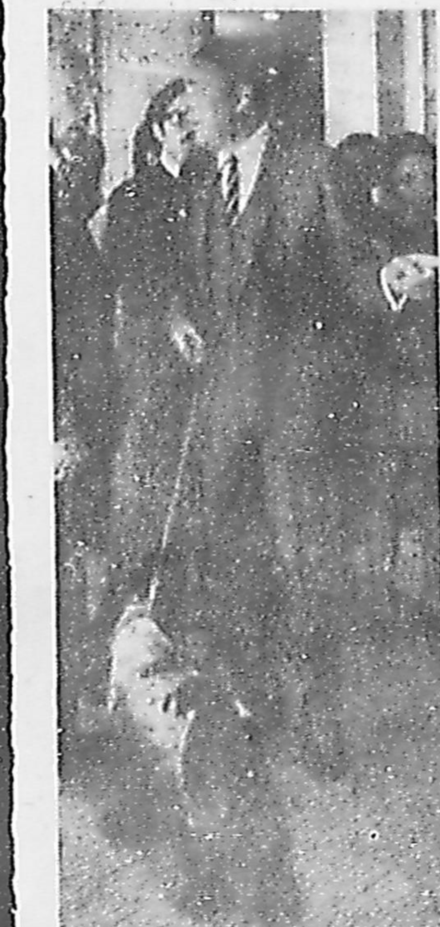
Trazendo mensagem de Nixon a Costa e Silva, o Embaixador Charles Burke Elbrick, dos EUA, chegou ontem ao Rio. Seu cão de estimação, Tony, também veio e bem preso na coleira. (Leia noticiário na página 2)