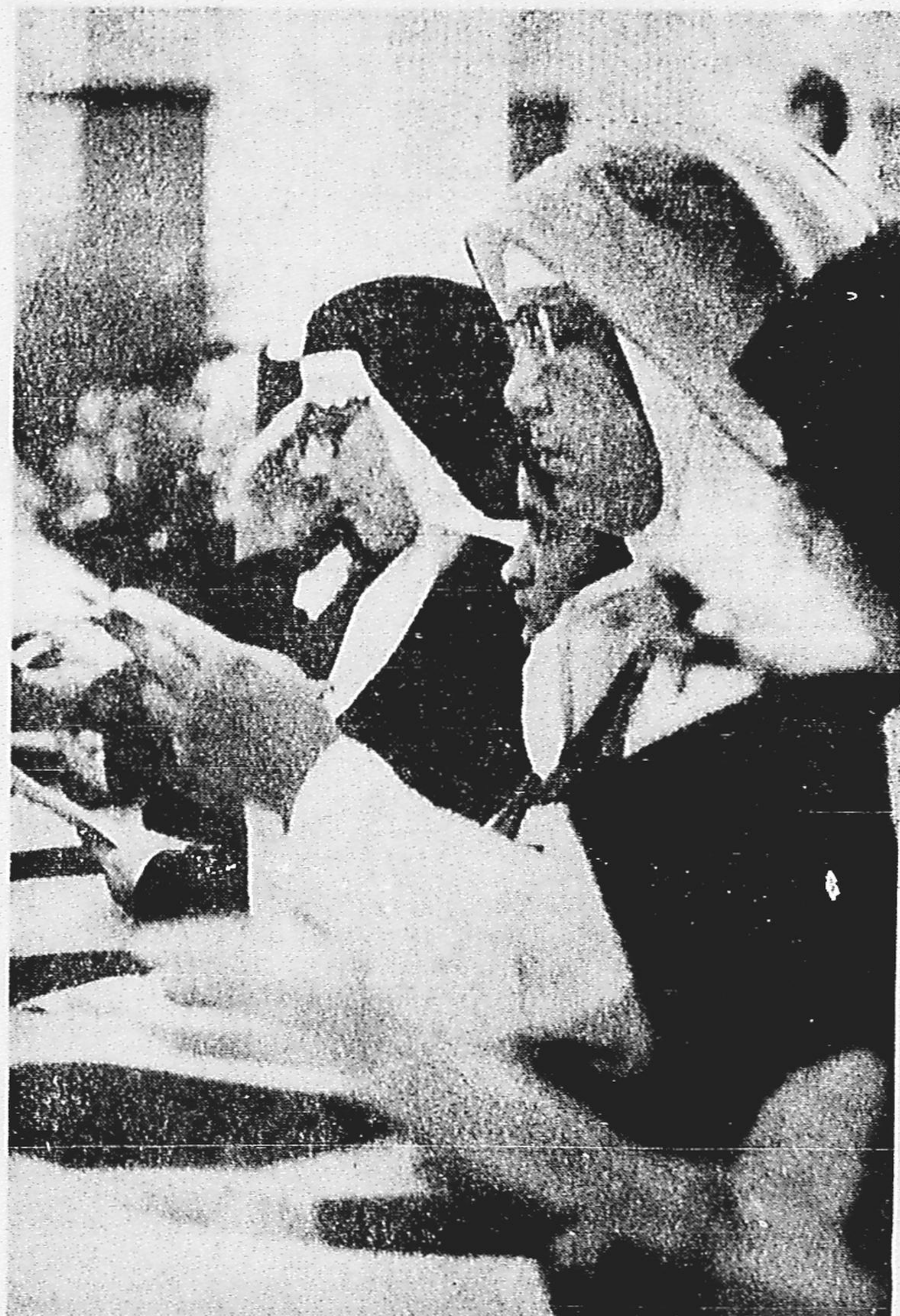
As freiras não faltaram com o seu apoio aos bispos, manifestado de vários modos.

Em entrevista exclusiva à Agência France Presse o Arcebispo de Teresina, D. Avelar Brandão, que também preside o Conselho Episcopal Latino-Americano, revelou, on'tem, que a Igreja não pode nem deve estimular movimentos que se transformem em revolução armada, para resolver os problemas latino-americanos. De outra parte, em carta enviada ao Marechal Costa e Silva, doze prelados — numa aparente cisão do pensamento da Igreja no Brasil — afirmam que as últimas manifestações de sacerdotes e leigos não exprimem o pensamento do clero. (P. 8)