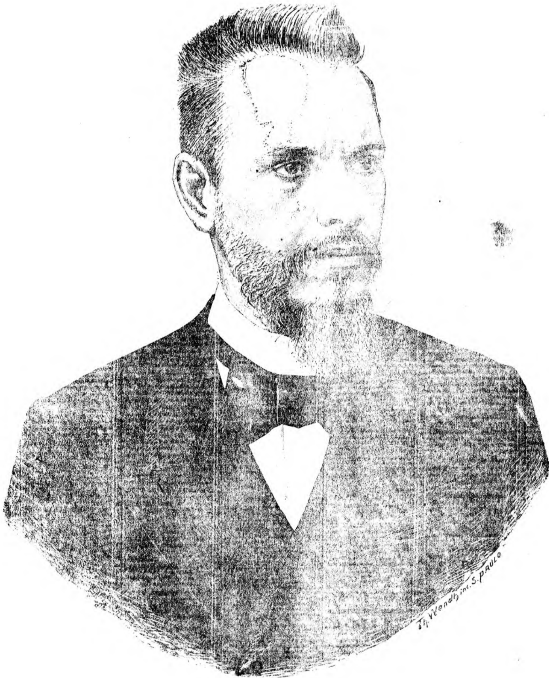
DR. BERNARDINO DE CAMPOS

SÃO PAULO Quinta-feira, 22 de Maio de 1902