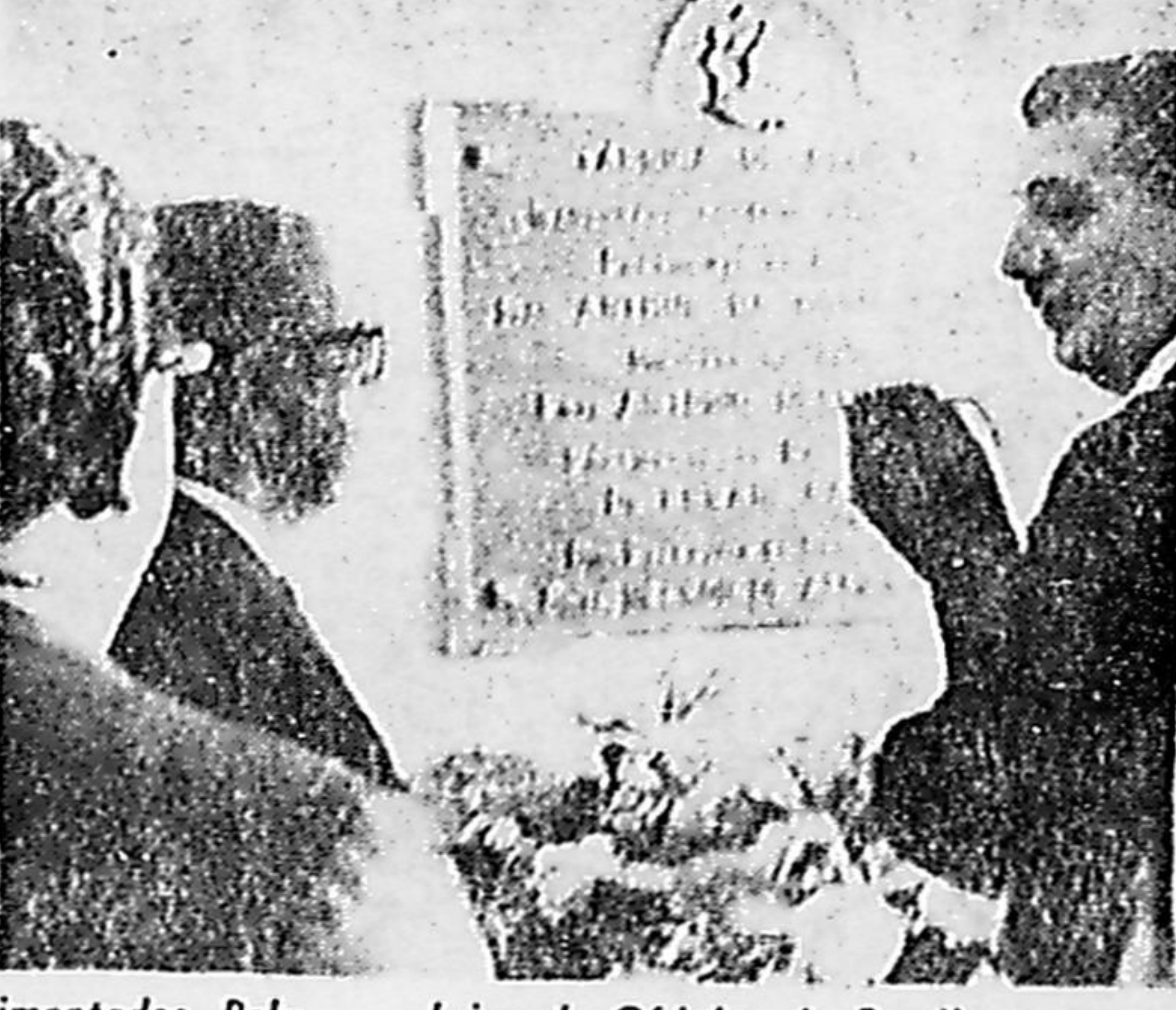
brica de Cédulas do Brasil, com capacidade para produzir 300 milhões de notas anualmente. No Palácio Laranjeiras, o Presidente recebeu os generais recentemente promovidos e deu posse ao novo chefe do SNI, General Carlos