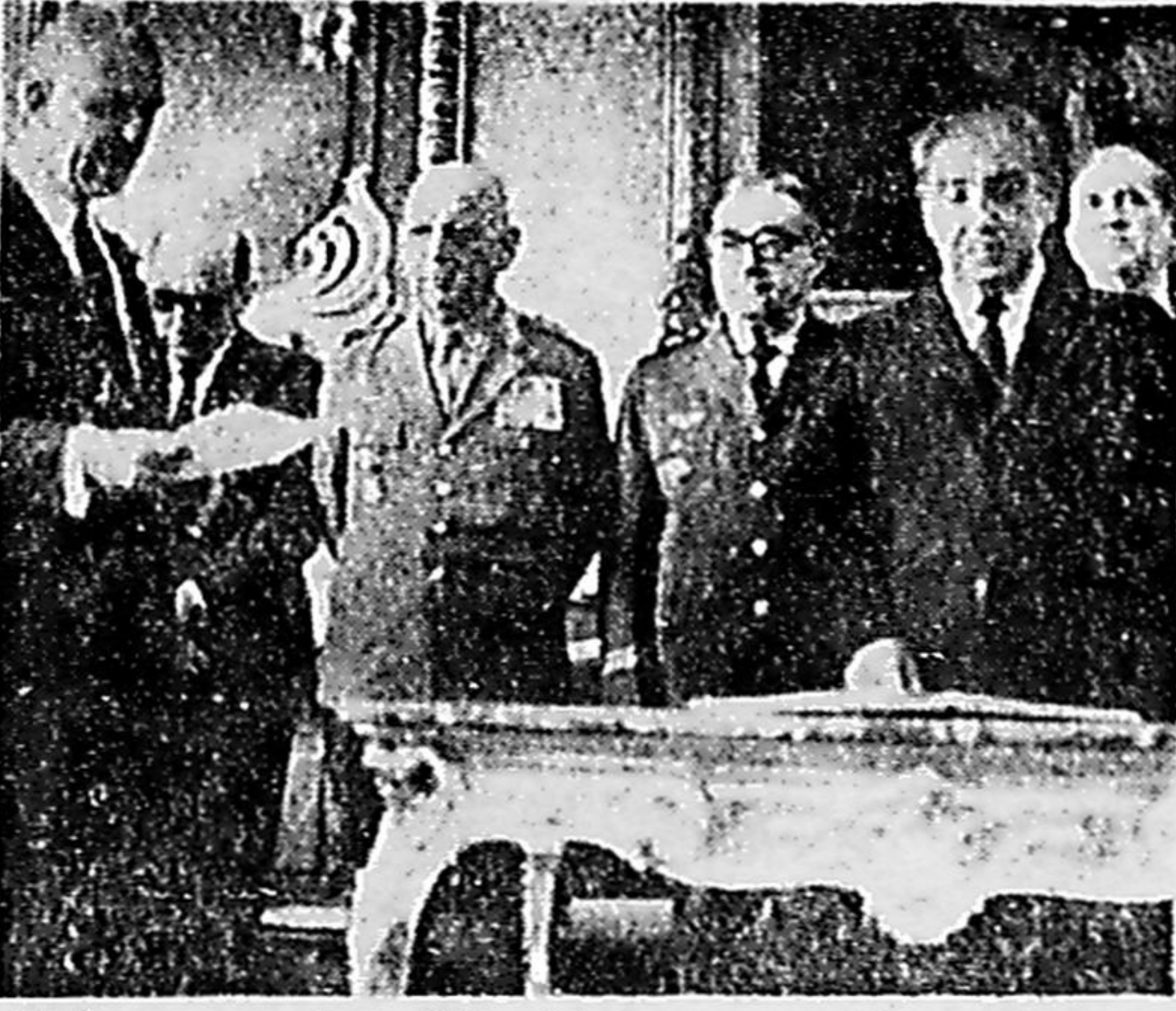
Alberto Fontoura. Além desses acontecimentos, registrados na série de fotos acima, o Presidente recebeu o ex-Chanceler alemão Ludwig Erhard, ao qual disse que o capital estrangeiro está voltando ao Brasil. (Leia na página 4)