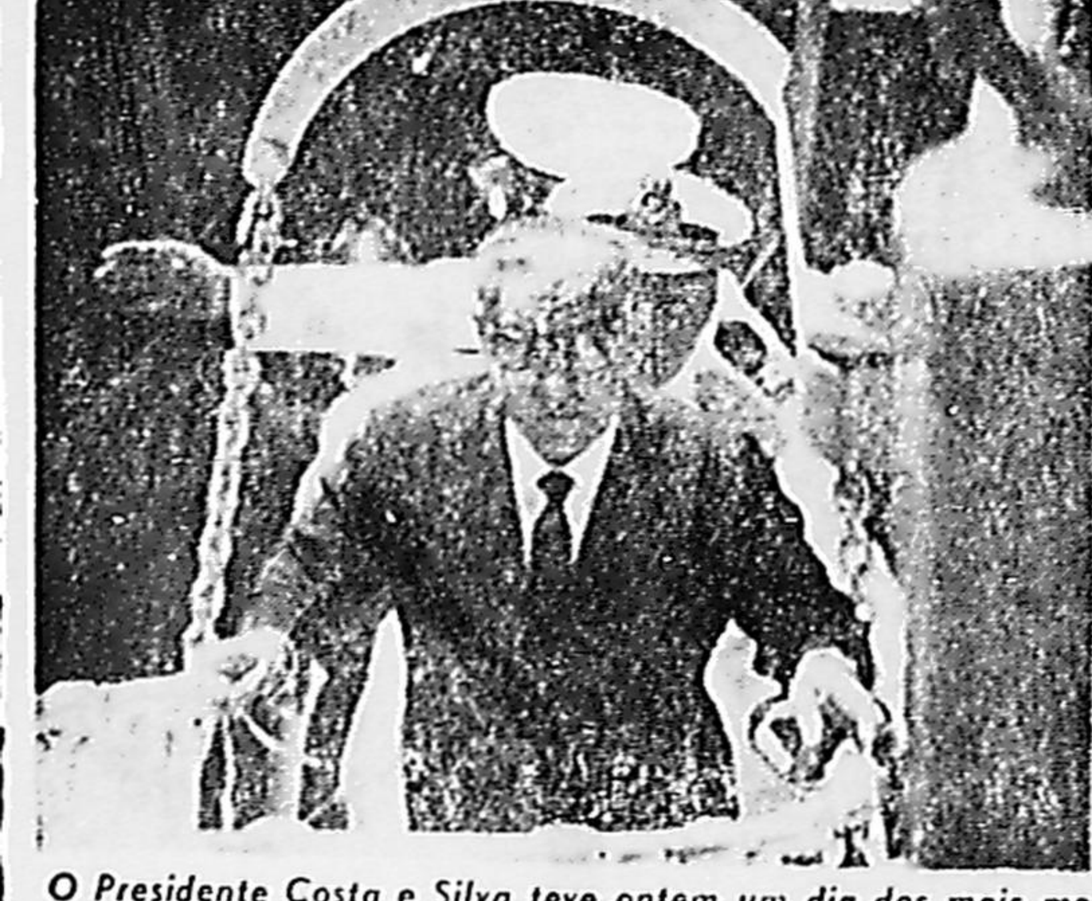
O Presidente Costa e Silva teve ontem um dia dos mais movimentados. Pela manhã, esteve no Corpo de Fuzileiros Navais e visitou o navio-escola "Custódio de Melo", onde almoçou. À tarde, na Casa da Moeda, inaugurou a Fá-