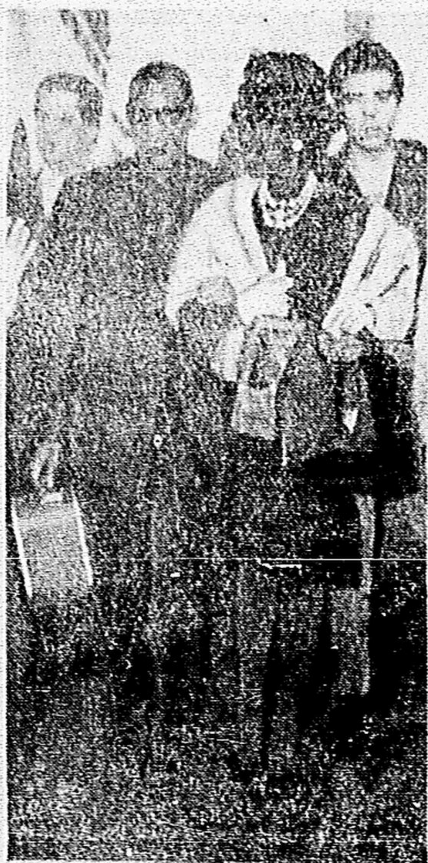
Está no Rio, desde ontem, devendo estrair, hoje, a noite, no Teatro Municipal, o cantor negro norte-americano Ray Charles, que na foto aparece em companhia de sua secretária, pouco após sua chegada ao Aeroporto Internacional do Galeão, a frente de uma comitiva de 38 pessoas. Mostrava-se ele um tanto encabulado e não quis falar à imprensa, o que confirmou seu anunciado temor. (Leia na Página Seis do 2º Caderno)

Ante o ambiente explosivo de Birmingham, no Alabama, onde 4 crianças negras foram mortas e 12 outras ficaram feridas, num atentado a bomba de dinamite contra uma Igreja Batista, este carro de assalto toma posição de combate em plena cidade, agora transformada em verdadeira praça de guerra, reforçando a Polícia, ao mesmo tempo, seus efetivos. (Leia Noticiário na Pág. 6)