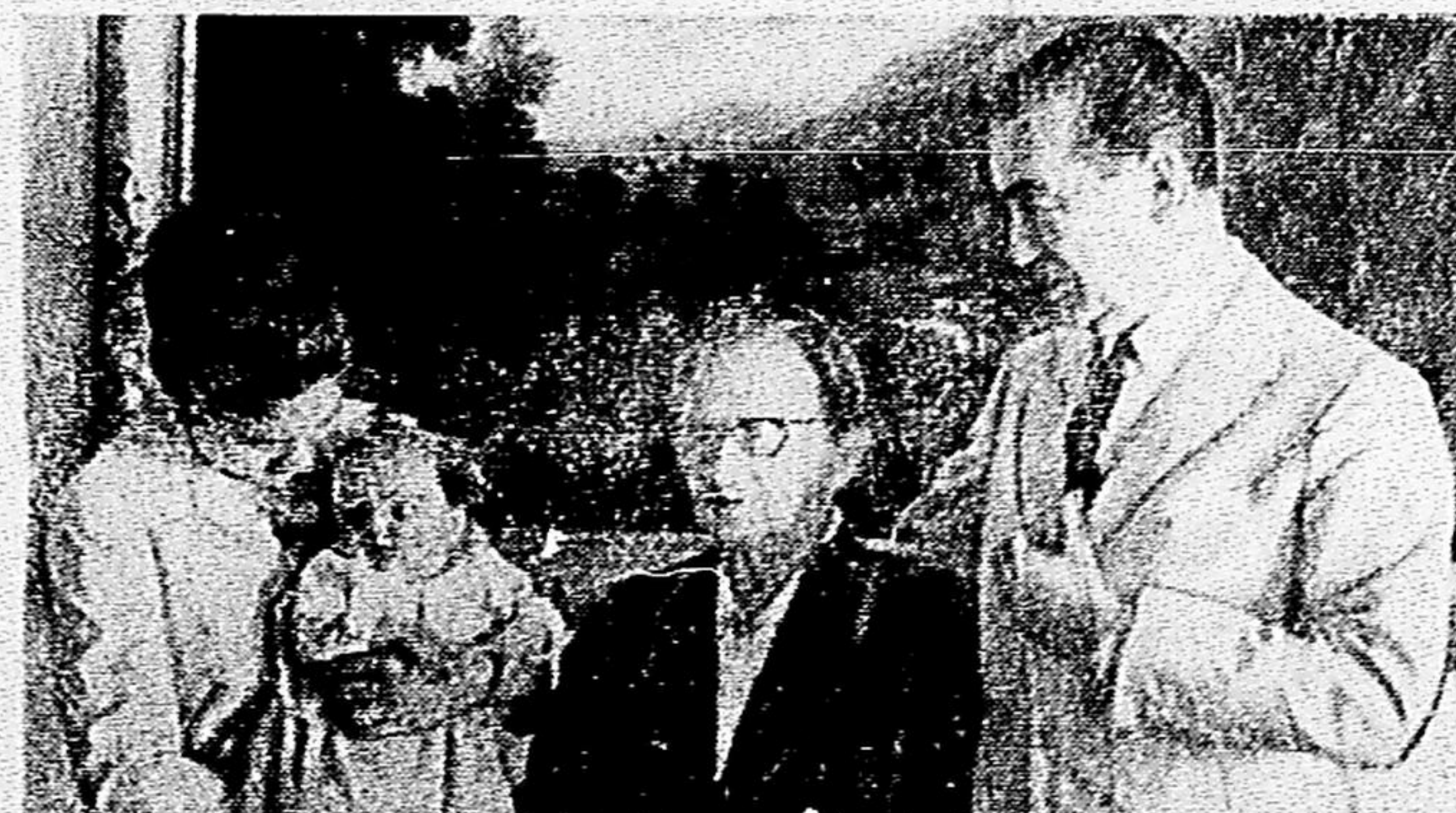
O Senador Juscelino Kubitschek declarou, em São Paulo, que lhe serão suficientes os três primeiros anos de governo para promover completa revolução na agricultura brasileira, modernizando a produção e inundando as cidades com a estrutura das colheitas. Na foto, 4 gerações de Kubitschek: ao centro, D. Júlia, que fazia anos, JK e Márcia, com a neta, em tocante encontro realizado ontem à tarde, no Rio. (Na P. 4 a foto de JK em S. Paulo)

CONSIDERA-SE, já agora, fortalecido o ponto de vista do Ministro da Guerra, General Jair Danlas Ribeiro, a favor da concessão do direito de voto a cabos e soldados, que poderão candidatar-se a cargos eletivos, desde que, a exemplo dos oficiais, sejam transferidos para a reserva.