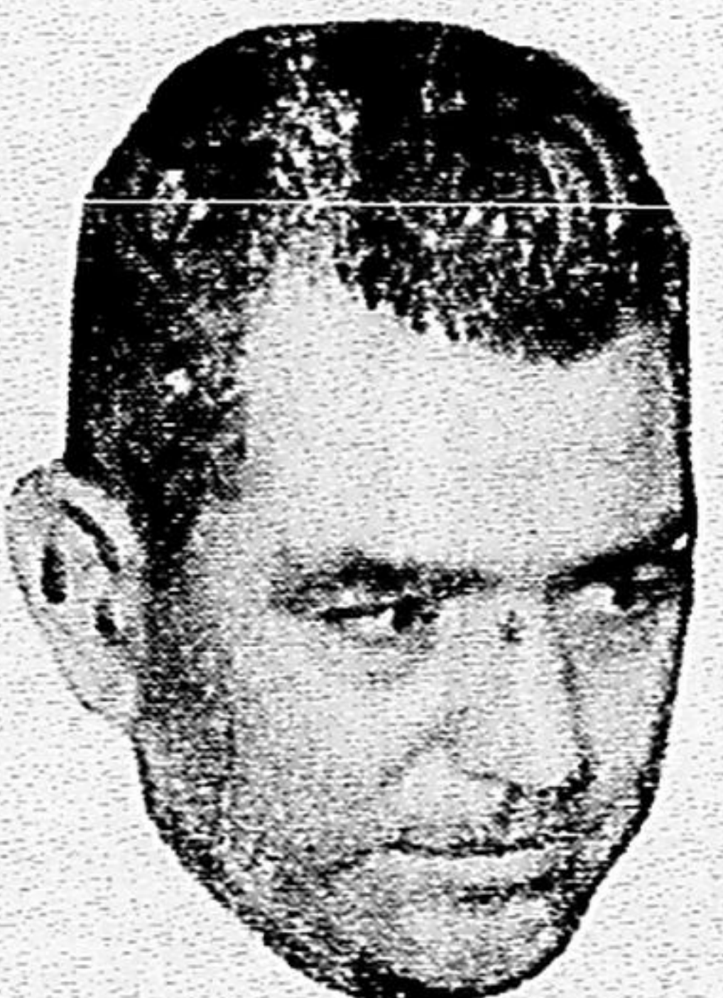
Está, já agora, inteiramente desfeita a alegação do francês Vincent Solo, de que matara e esquitejara a mulher e o enteadado por piedade e de que estava arruinado: ele possui milhões. (LEIA NA PÁGINA 9.)