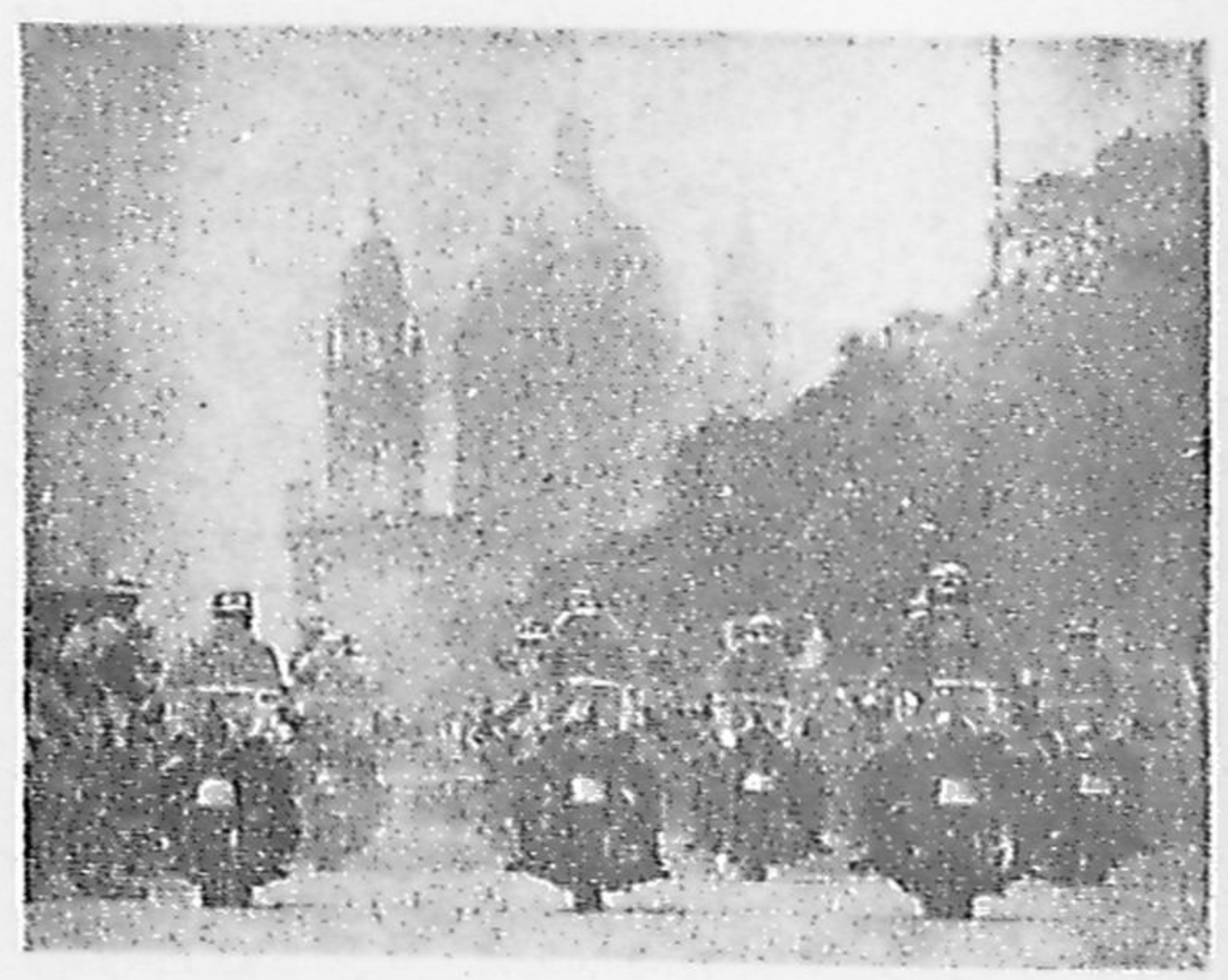
Em Brasília, a onça-mascote fugiu durante a parada e teve que ser agarrada a unha (Página 7)