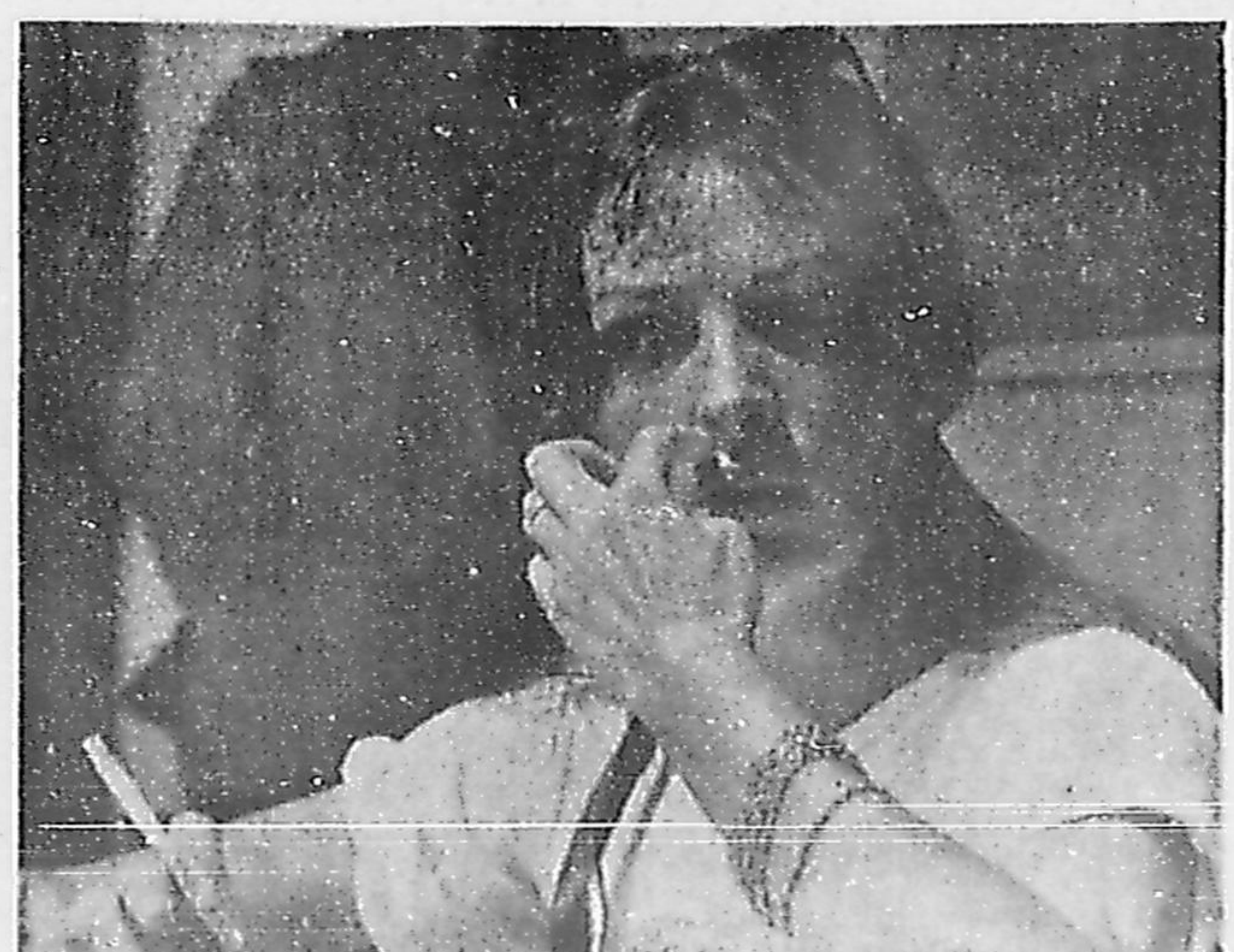
Laforêt em Copa só lamenta não ter um biquíni (2.º C.)