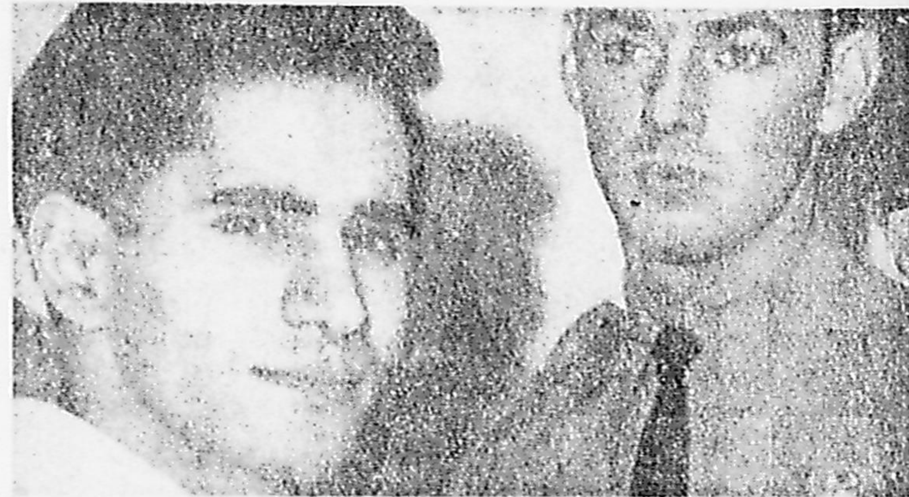
Não adiantou que o Senador Ted Kennedy pedisse, em carta manuscrita ao Juiz Walker, clemência para o assassino do seu irmão Robert Kennedy. A sentença foi confirmada: Sirhan (foto) vai mesmo morrer na câmara de gás. (Leia noticiário na sétima página)