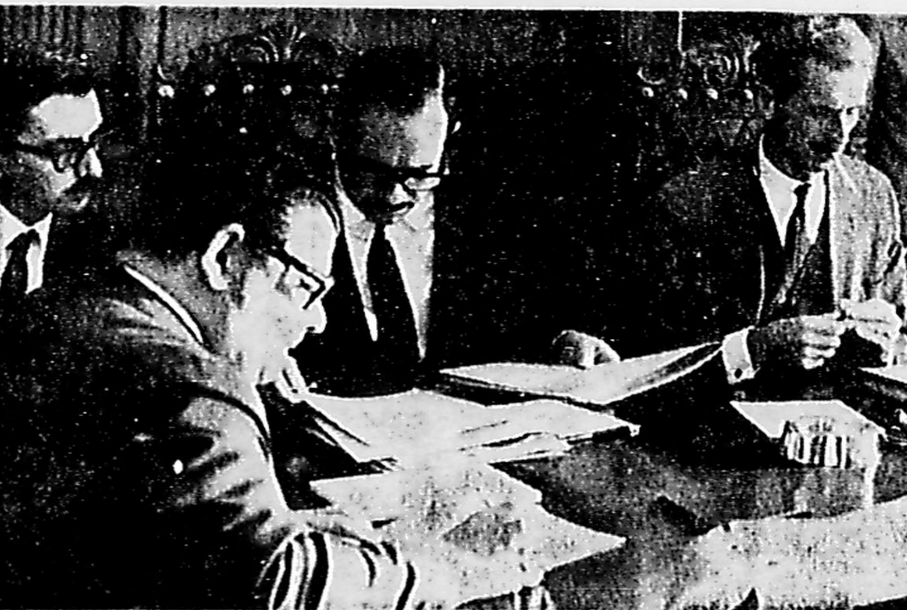
O Ministro Delfim Neto, em reunião de duas horas com os banqueiros (à esquerda), comunicou-lhes a resolução do Conselho Monetário Nacional que fixa a taxa de juros em 1,8 por cento ao mês, a partir do dia 1 de junho. Essa taxa inclui encargos adicionais para o desconto de duplicatas, contratos, promissórias e outros papéis de crédito curto ao comércio e à indústria. O Banco Central divulga hoje resolução fixando as tarifas médias a serem cobradas pelos serviços bancários até agora gratuitos. Os bancos que operam a 1,6 por cento podem carrear 50 por cento da compulsória para Obrigações do Tesouro. (Página 2)