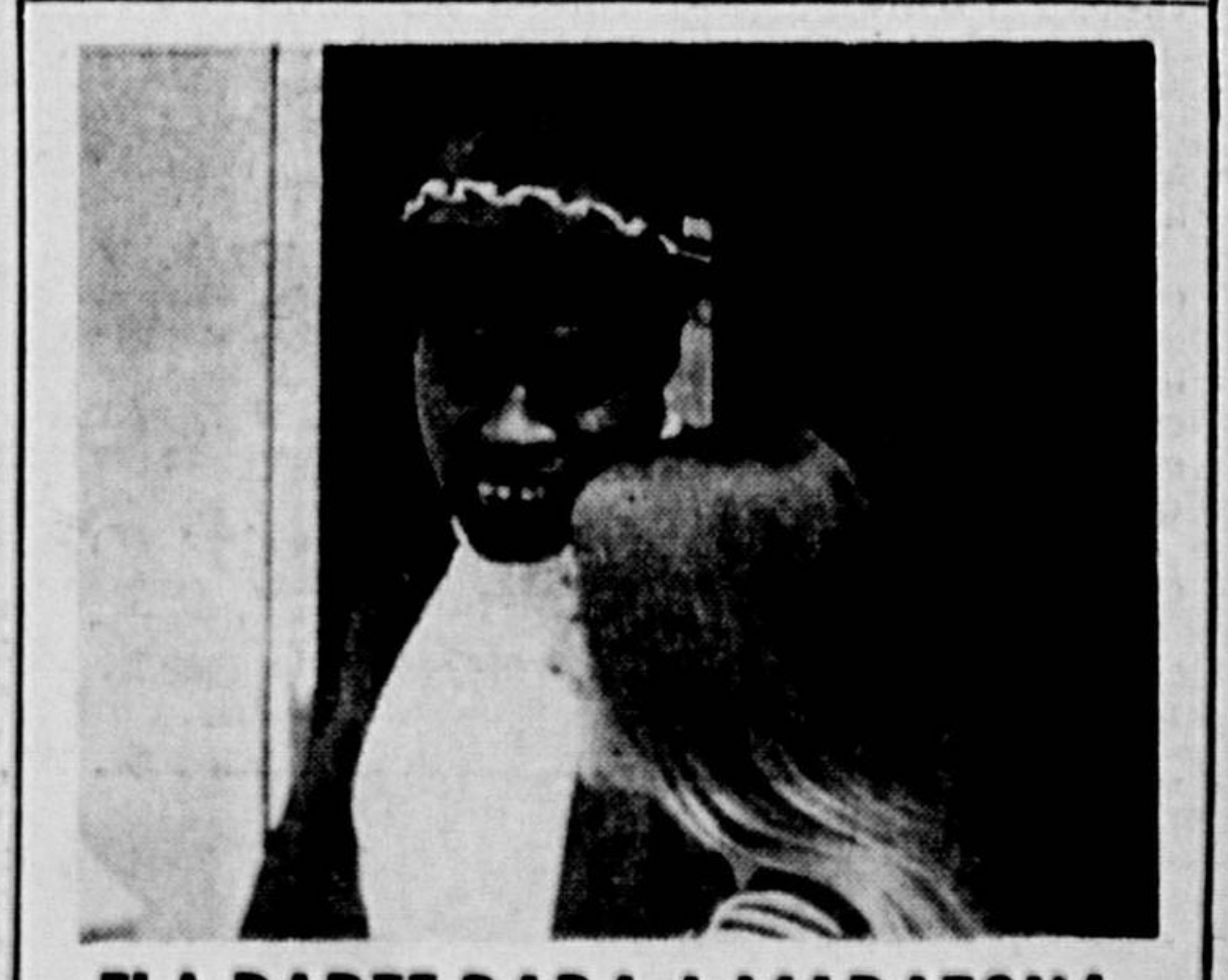
FLA PARTE PARA A MARATONA Para disputar 7 jogos em 12 dias — 6 dos quais em disputa de torneios internacionais — a delegação do Flamengo seguiu ontem para a Espanha, onde estreia amanhã em Barcelona. Os jogadores viajaram alegres com o prêmio pela vitória sobre o Vasco, e Fia apareceu no Galeão muito bem acompanhado. (Pag. 12)

O conflito de gerações, uma análise dos anseios da juventude de hoje e a certeza de que "tudo vai mudar, tudo está mudando", foram os temas da conferência "Rimbaud e a mocidade e a modernidade", pronunciada pelo embaixador e escritor Gilberto Amado, no Museu de Arte Moderna. (2.º Cad.)