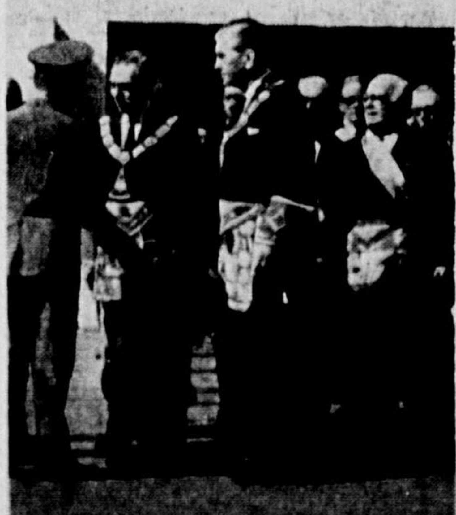
GRÃO-MESTRE CAXIAS Os maçons abriam a Semana do Exército homenageando o seu patrono — Duque de Caxias — ex-Grão-Mestre da ordem maçônica brasileira —, depositando uma coroa de flores no seu panteão, em frente ao Ministério da Guerra. (P. 9)