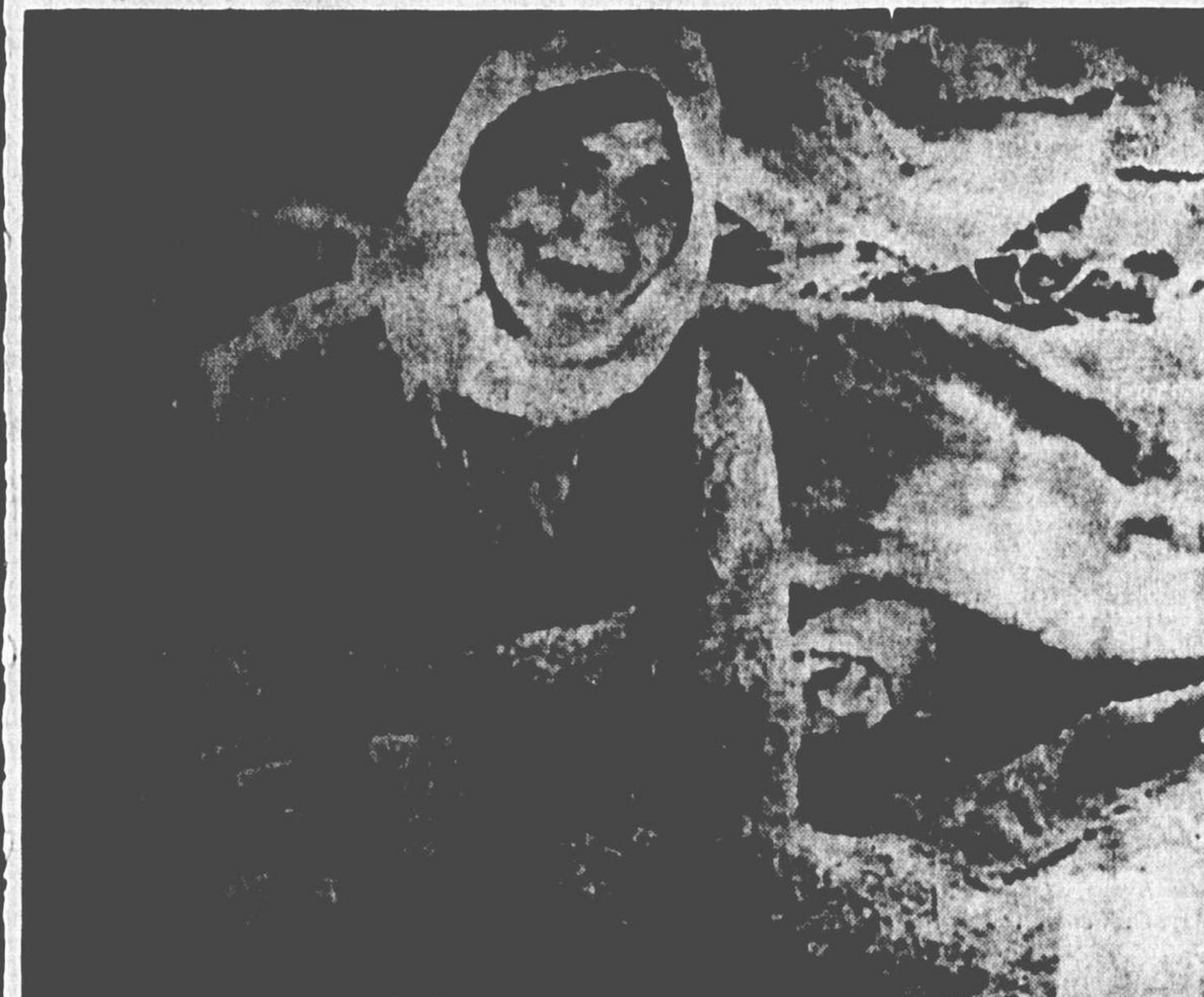
A face da anciã iraniana reflete o desespero diante da enorme tragédia de seu país.

A terra voltou a explodir, ontem, no Irã e na Turquia, aumentando o número de mortos e devastando mais ainda as regiões que haviam sofrido dois terremotos sucessivos em menos de 24 horas. Na Turquia foi atingida uma área de mais de 300 milhas, com a destruição de aldeias inteiras. Outros tremores de terra, sem vítimas, foram assinalados na Armênia (URSS), Japão e no fundo do Oceano Atlântico, próximo a Porto Rico. Só no mês passado a América teve cerca de mil terremotos.