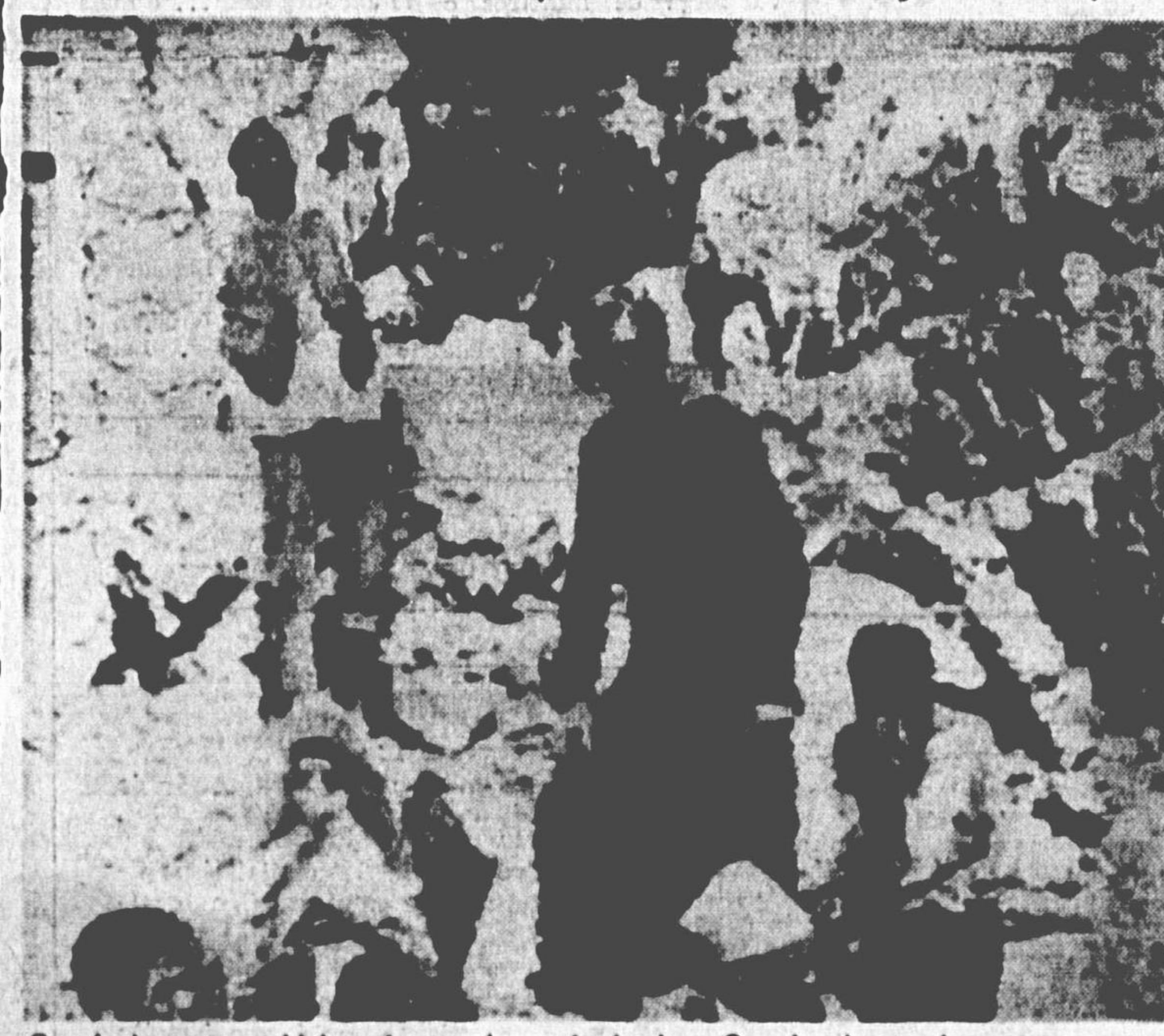
Gonabad era uma aldeia próspera. Agora é só ruínas. Os sobreviventes buscam os mortos.