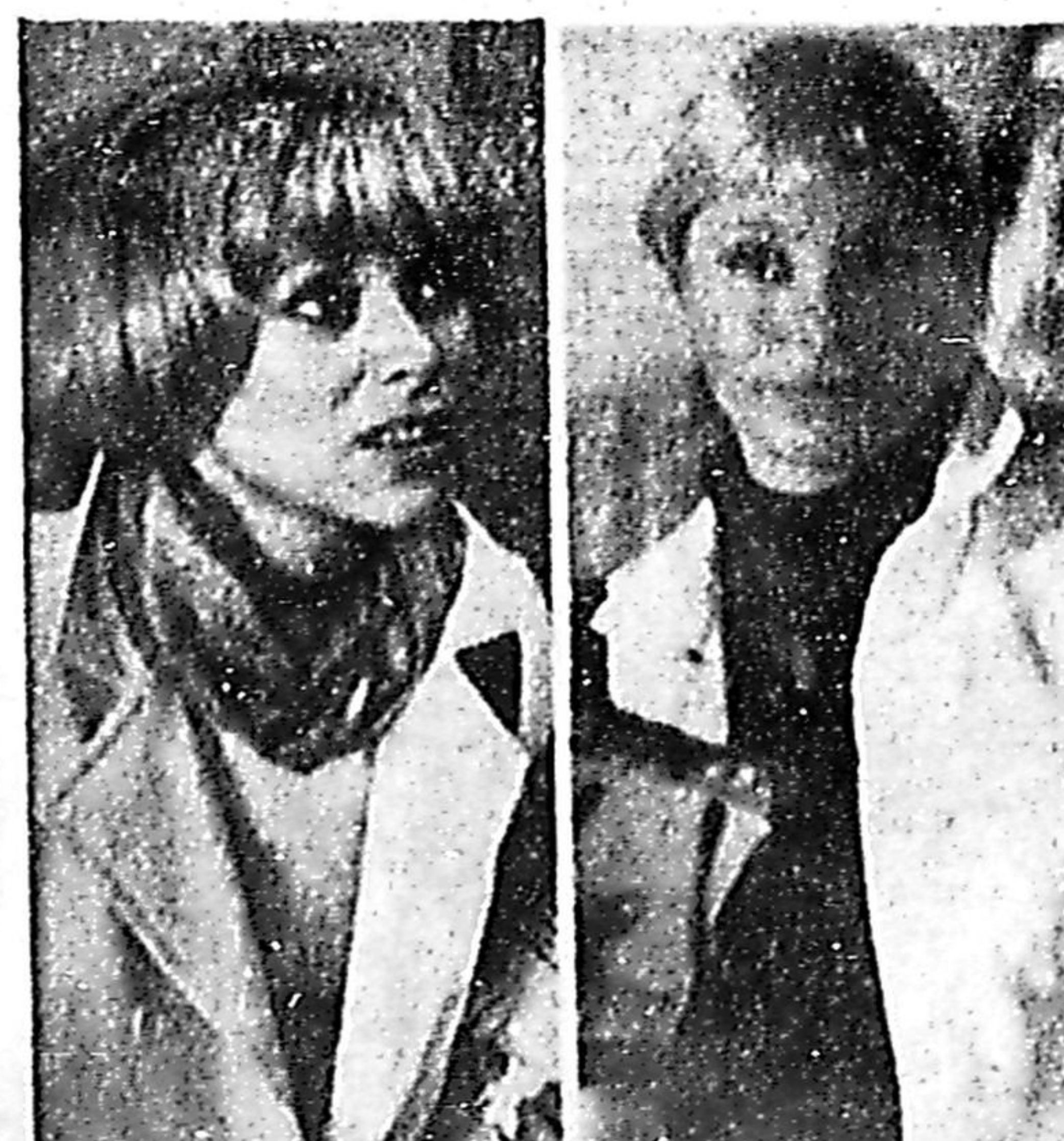
Mireille Darc (à esquerda) e Ingrid Thulin chegaram ontem e fizeram, ambas, sucesso pela sua beleza. A francesa não fez elogio algum à sua conterrânea Brigitte Bardot.