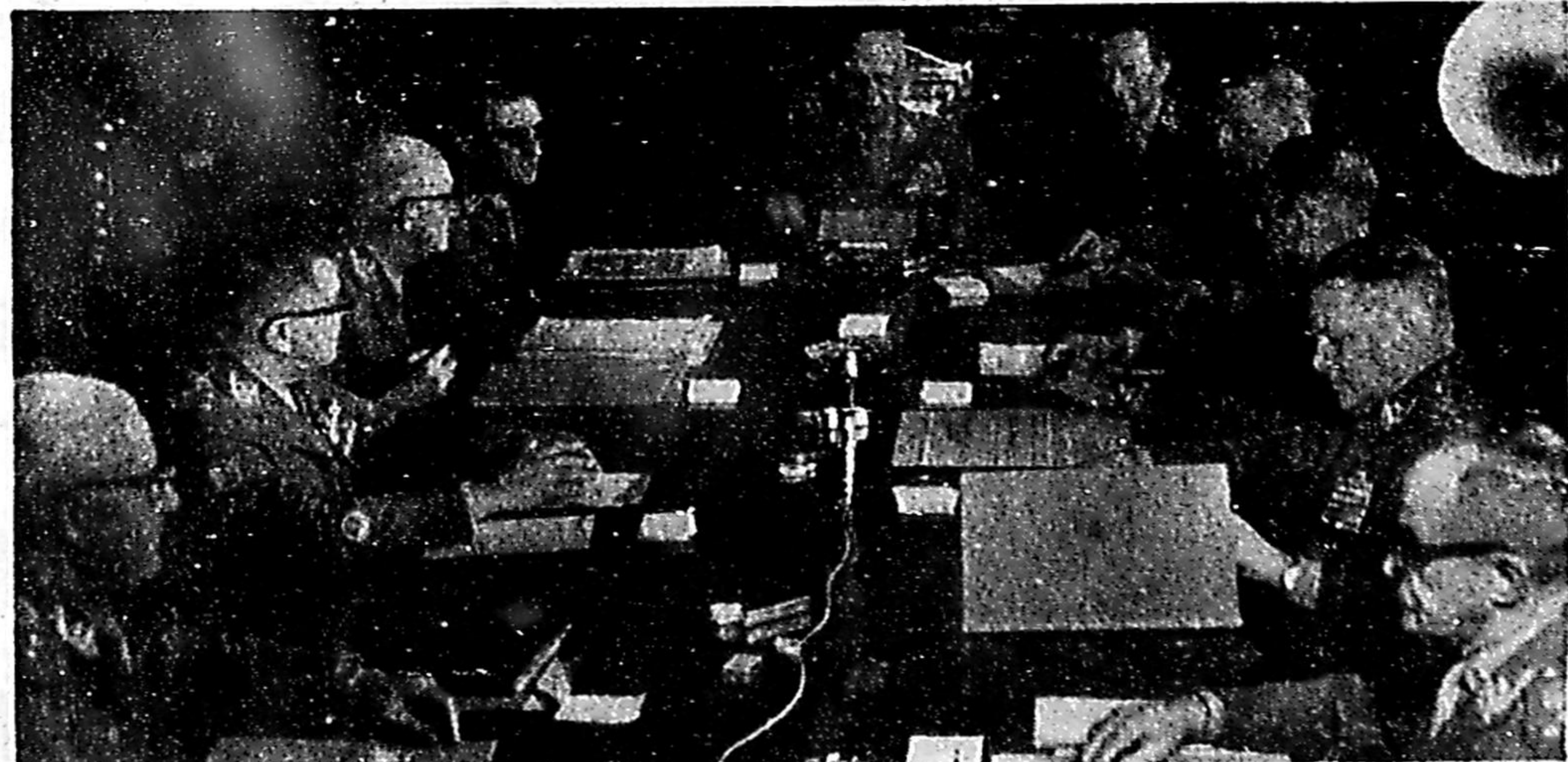
ALTO COMANDO DO EXÉRCITO ESTÊVE REUNIDO TRÊS HORAS O Alto Comando do Exército esteve reunido ontem durante três horas, quando foi examinada a lista de nomes a ser enviada ao Presidente da República para preenchimento das vagas de três Generais-de-Exército, 6 de Divisão e 7 de Brigada. Também foi abordada a criação do Comando de Brasília. (Leia amplo noticiário na terceira página)