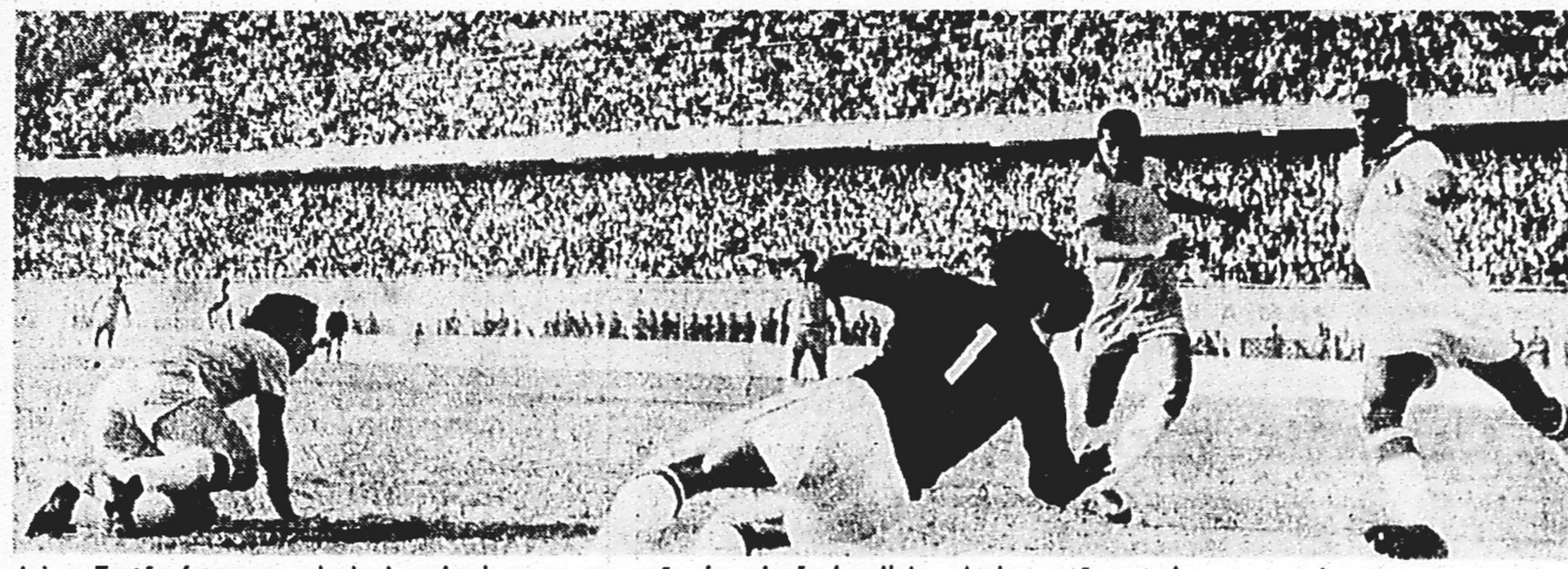
Jair e Tostão foram os principais goleadores na excursão da seleção brasileira. Ambos estão cotados para as futuras convocações.