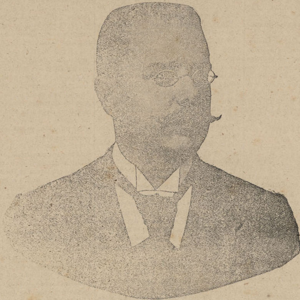
Dr. Pedro Augusto Carneiro Lessa

Lente Cathedatico da Faculdade de Direito de S. Paulo