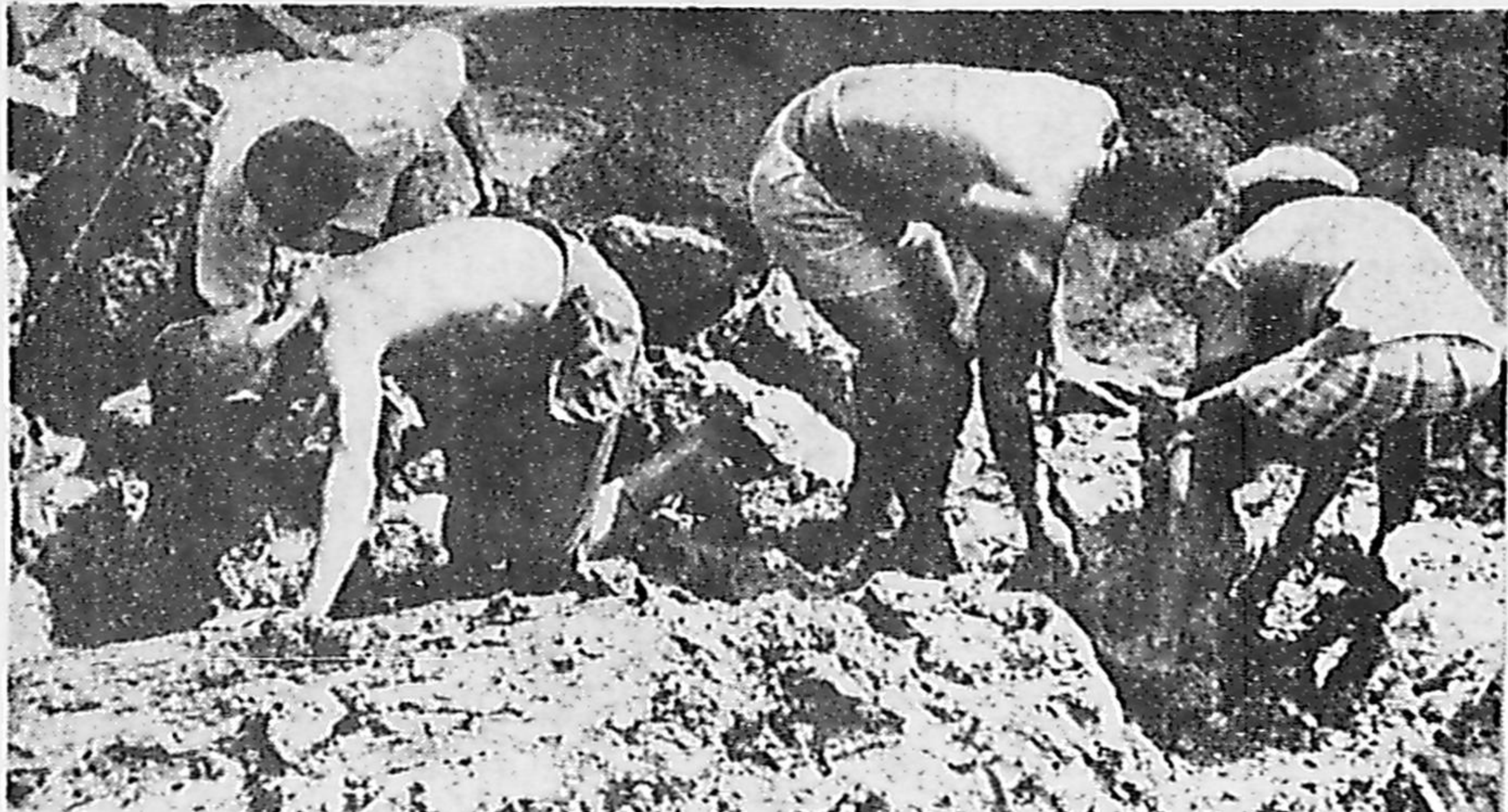
As buscas pelo corpo do menino Paulo prosseguem na favela da Vidigal, sob uma pedra de 20 ton. (P. 4)