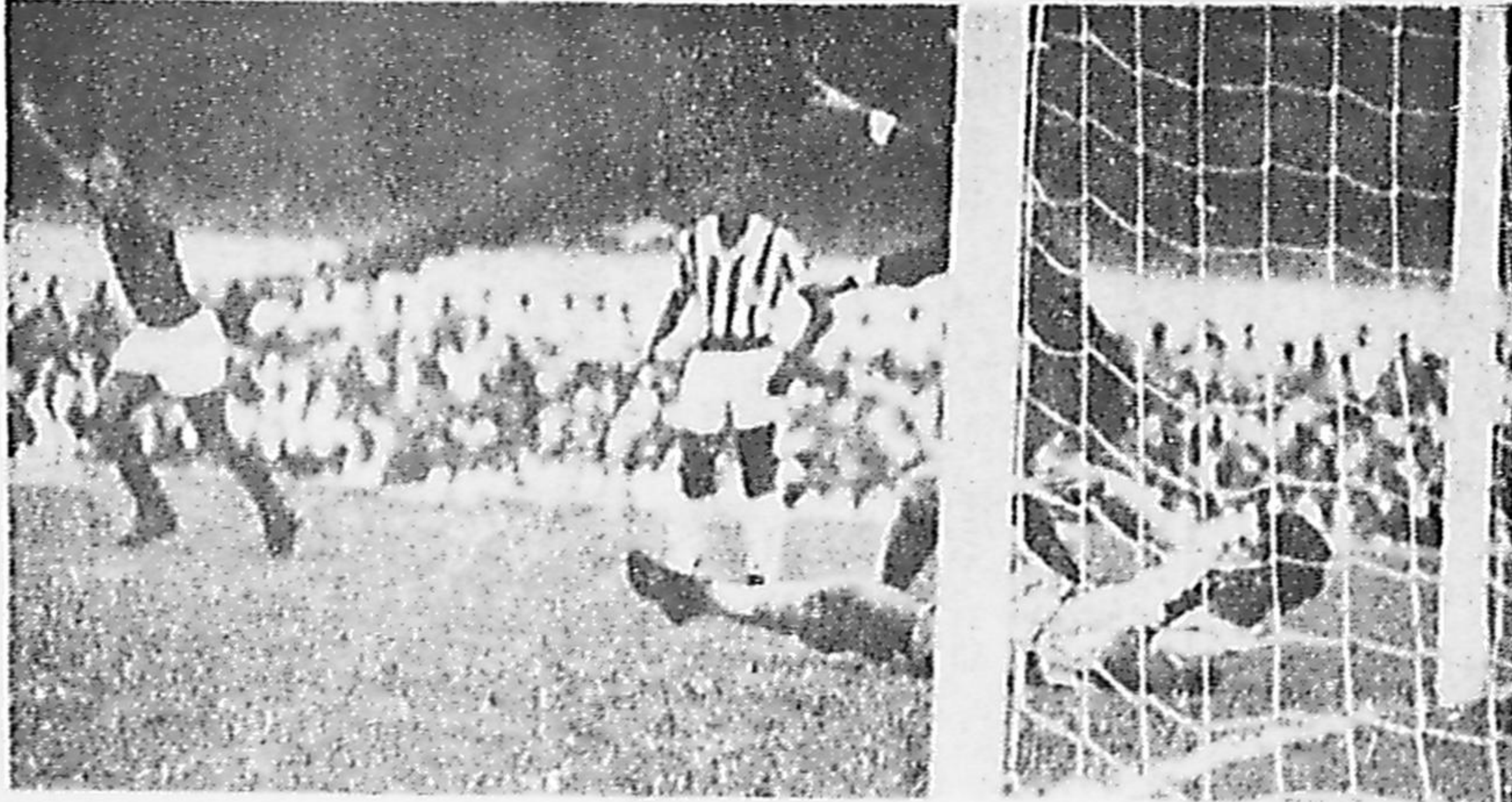
Assim o Flamengo comemorou seu primeiro gol ontem no Maracanã, abrindo o escore de 2 x 0.

A catimba e a violência foram a tônica de dois jogos do Campeonato: ontem, em Teixeira de Castro, houve quatro expulsões e o Vasco perdeu um ponto e a liderança, que agora é só do América. Sábado, o Flu escapou das botinadas, fazendo 2 x 1 sobre o Olaria. O Flamengo venceu fácil, achando seu melhor jogo, ante um Bangu desconcertado (2 x 0) e continua vice-líder, pagando "bicho" no vestiário. No sul, o Inter fez 2 x 1 no Benfica. (Leia no Caderno Esportivo)